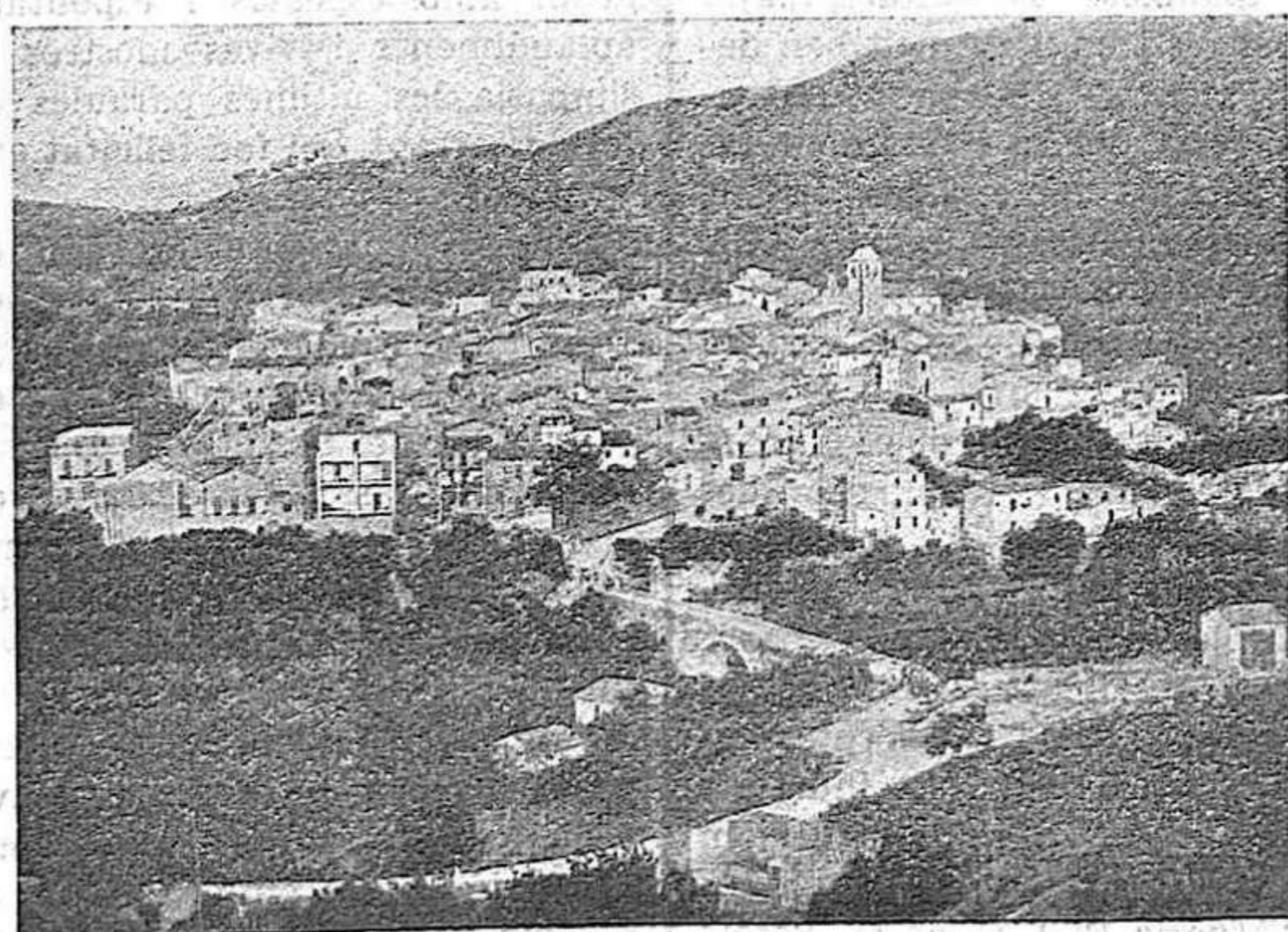
Vista general de Riudecanyes

la té serà curta i deguda a l'obra personal d'algun dirigent, que per cert no és pas ni de bon troç el que es busca. Així, doncs, es presentà la qüestió amb tota cruesa: —Cal tenir lloc social i amb bones condicions de capacitat i comoditat. Erem uns deu o dotze joves fejecistes i deu o dotze simpatitzants o protectors—tots, sense excepció, de situació econòmica ben