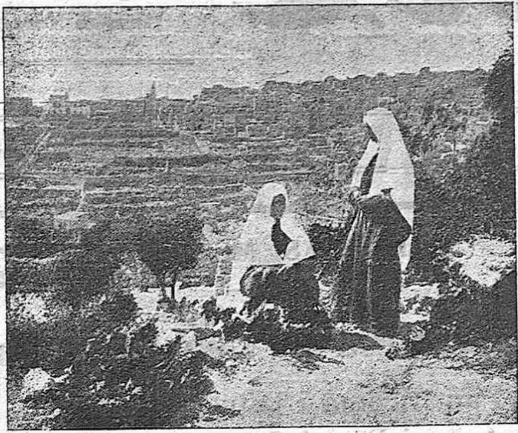
Vista general de Nazaret