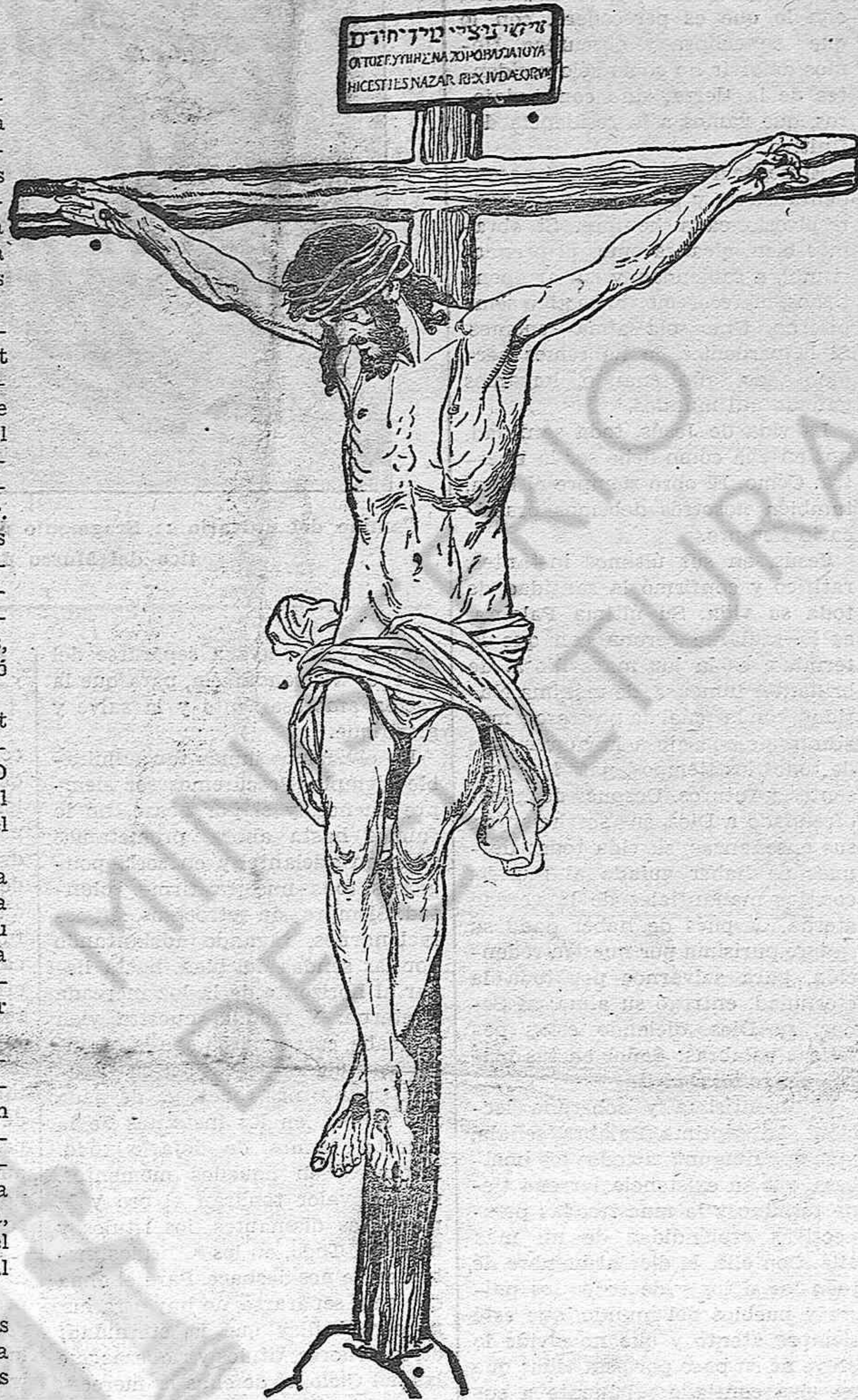
Crucifijo de la Catedral de Sevilla, custodiado en la Sacristia de los Cálices y debido al gran imaginero Martínez Montañés