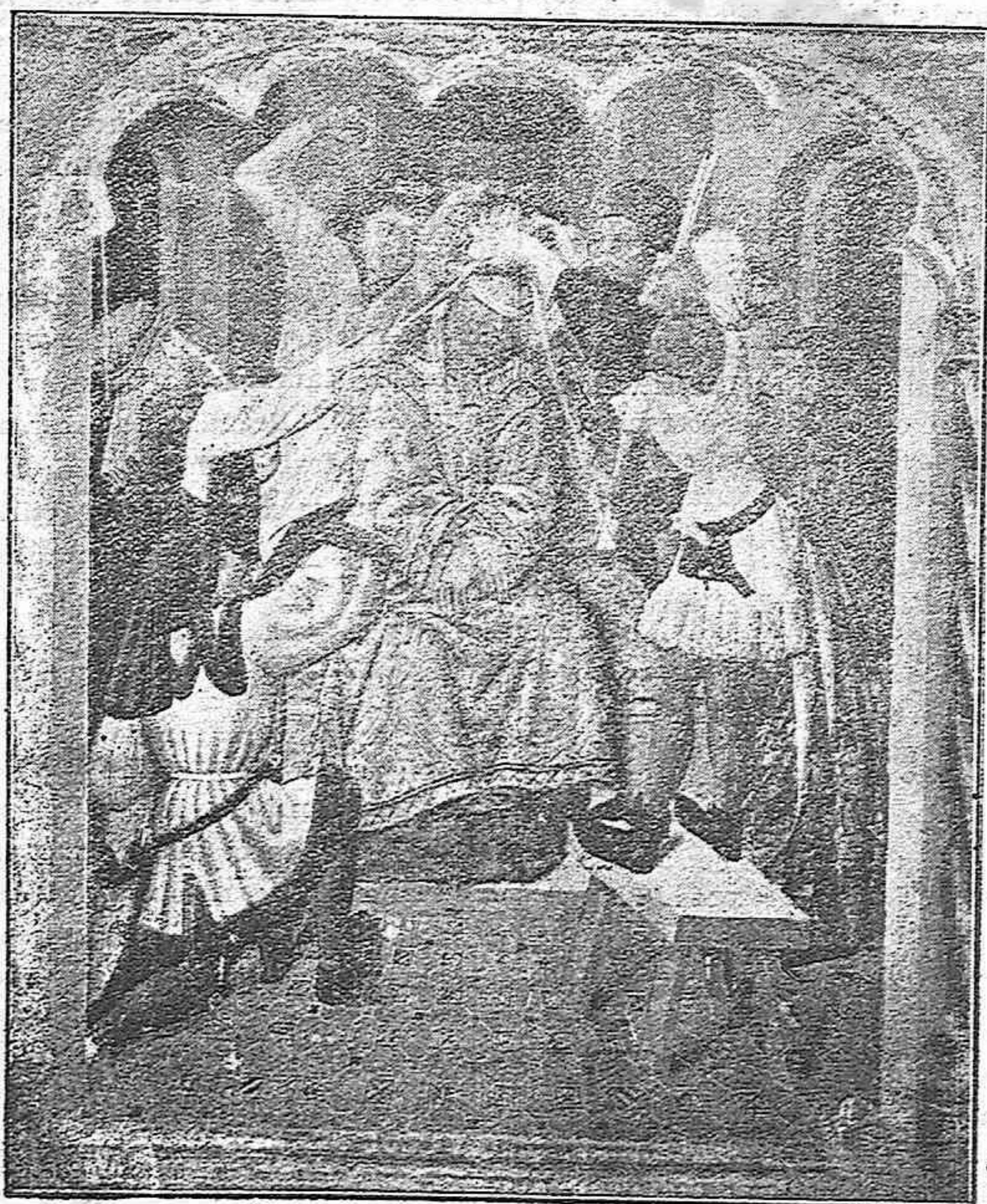
La Coronación de espinas. :: Tabla de un retablo gótico del Museo Diocesano del siglo XV y escuela valenciana