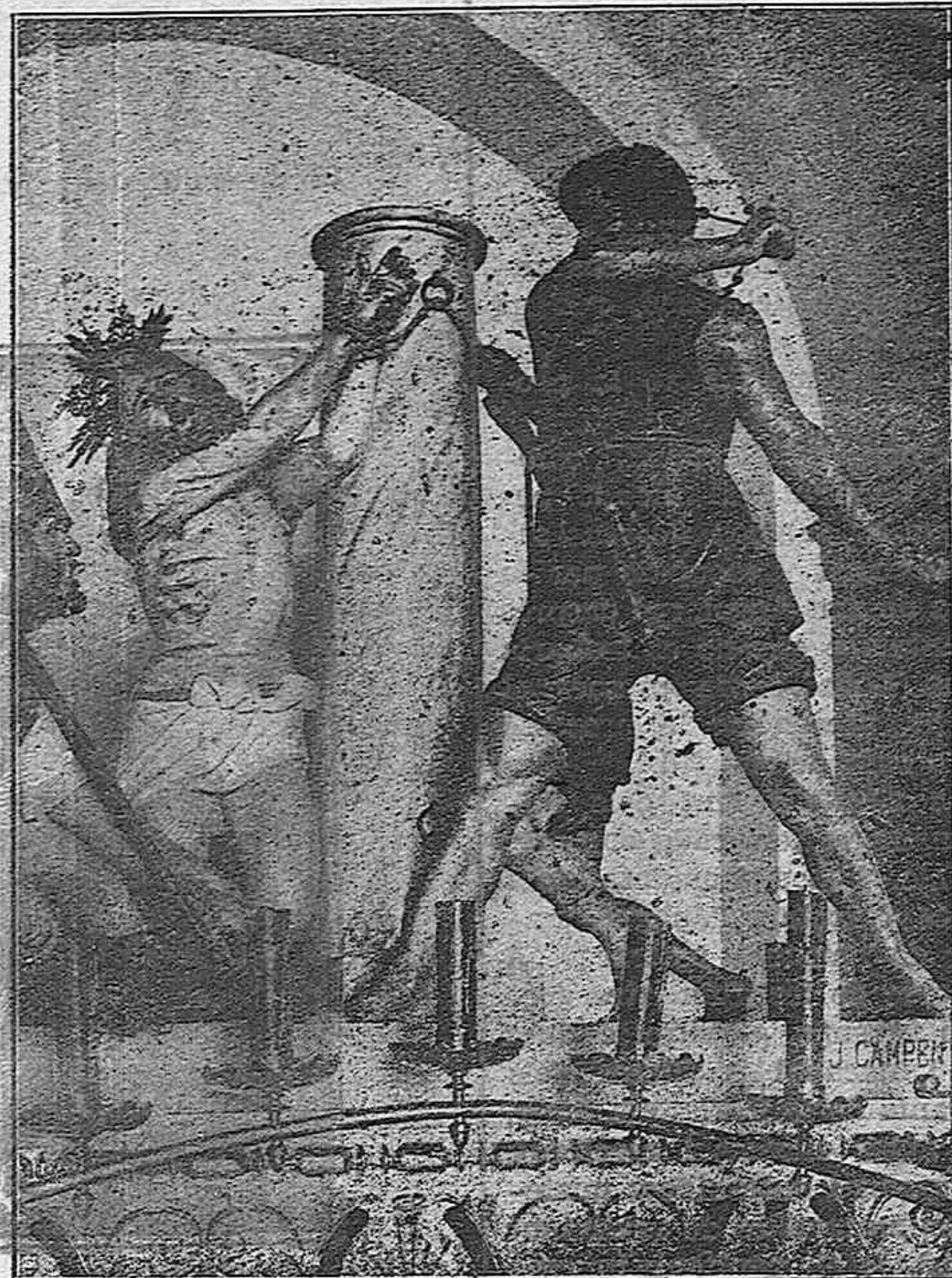
La Flagelación Grupo escultórico de Campeny, propiedad de la Congregación de la Purísima Sargre