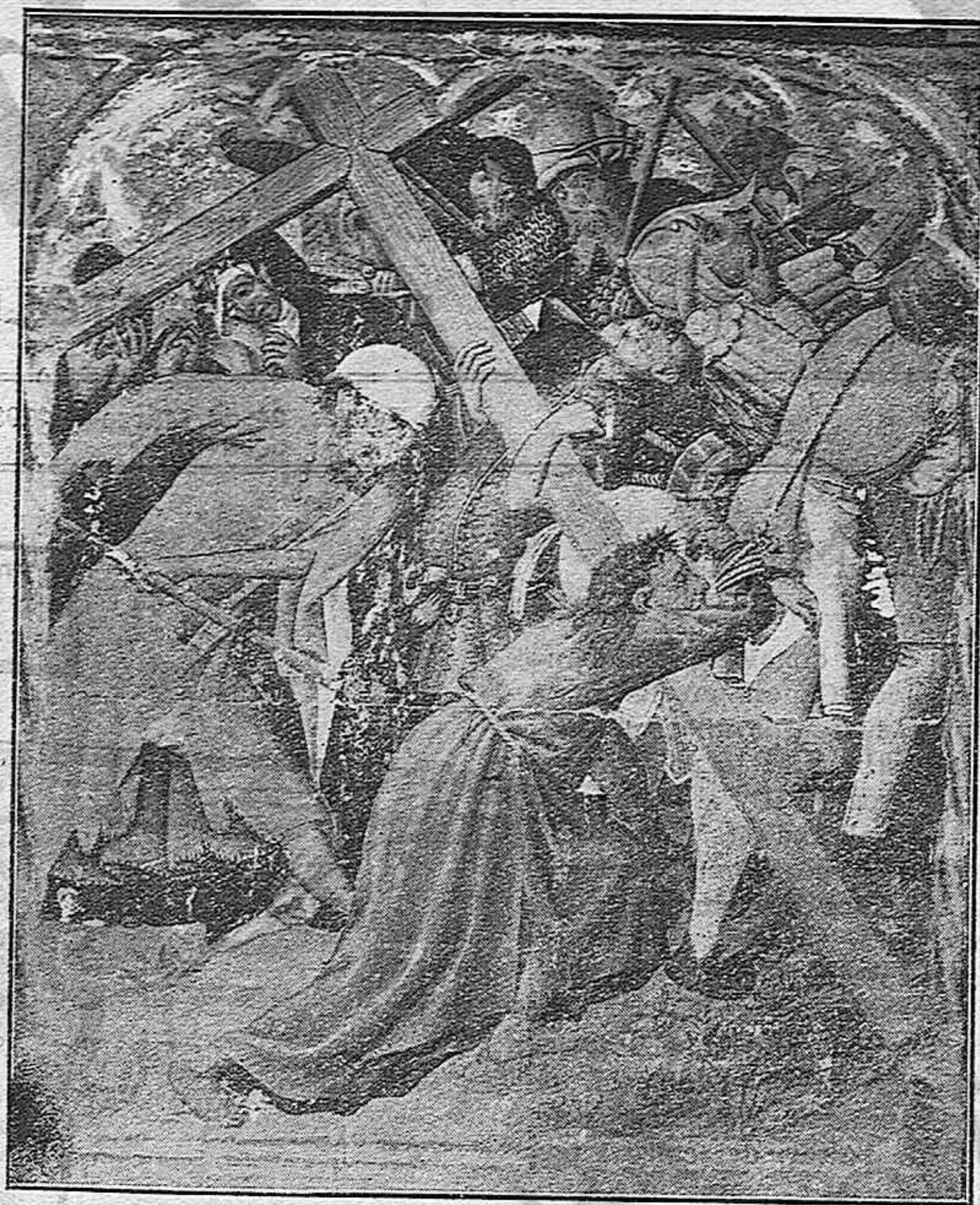
Camino del Calvario :: Fragmento de la pradera de un retablo gótico del Museo de la Catedral

La séptima Palabra, nos enseña y mueve a mirar arrepenidos la gran misericordia de Dios; a confiar en Él, y darle nuestra alma,