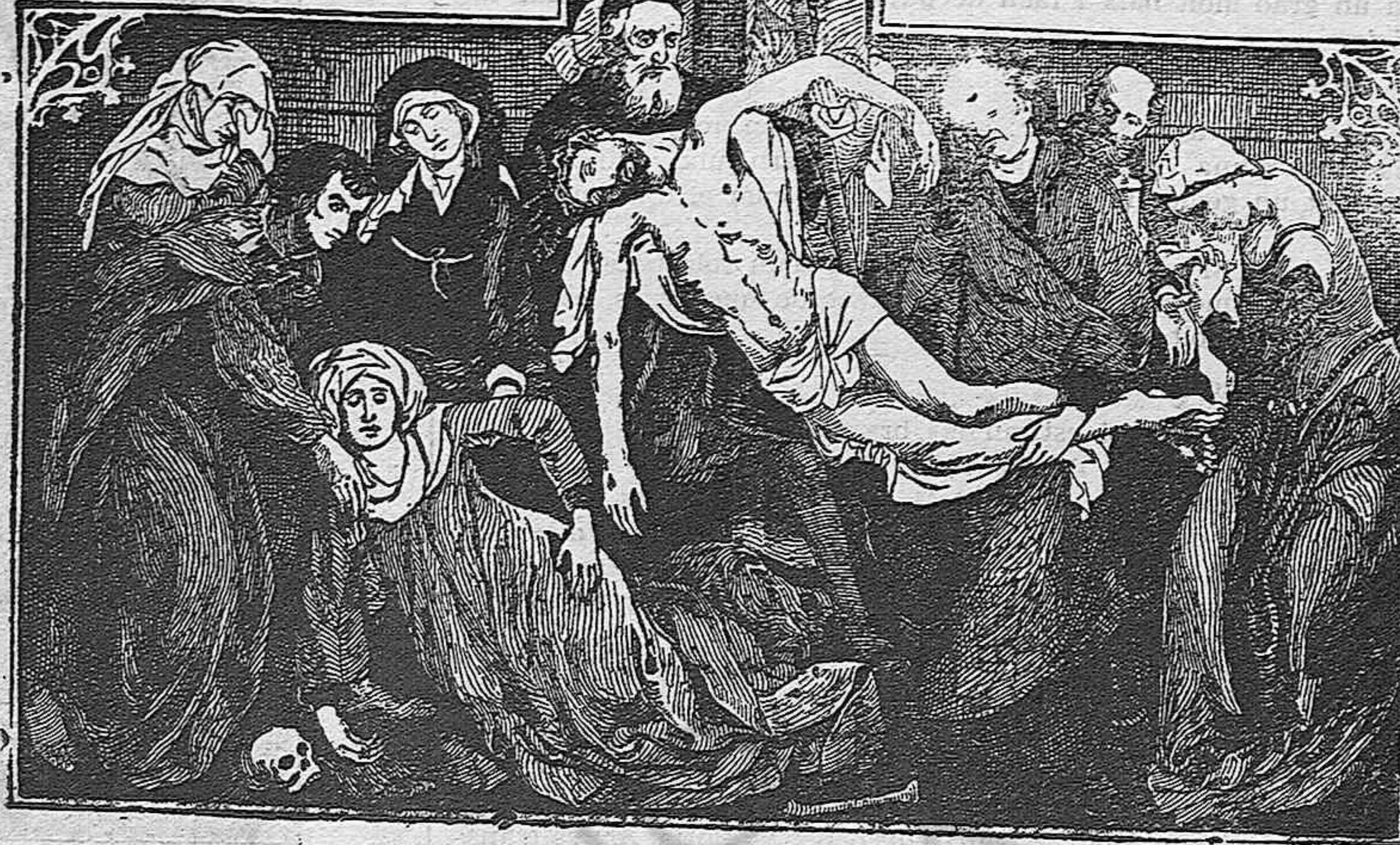
Cuadro del renombrado pintor flamenco Van der Weiden

teix a baix a la porta. No s'havien pas vist.