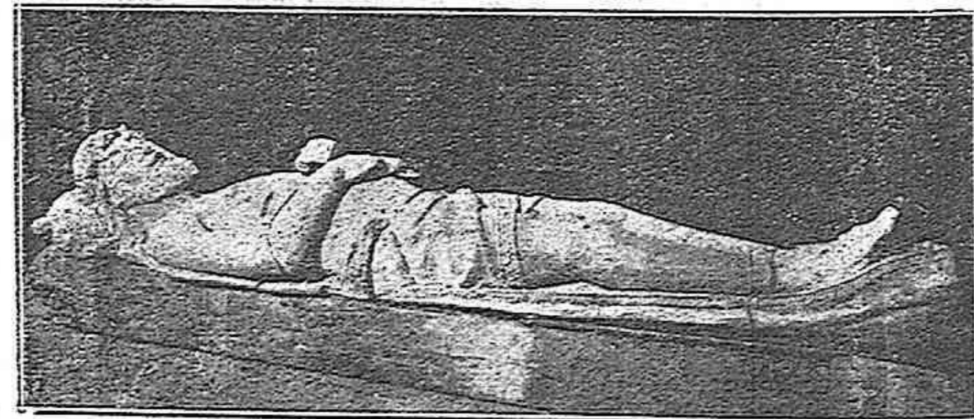
Cristo yacente :: Imagen en terra cotta, procedente del Monasterio de Santa Clara de esta ciudad