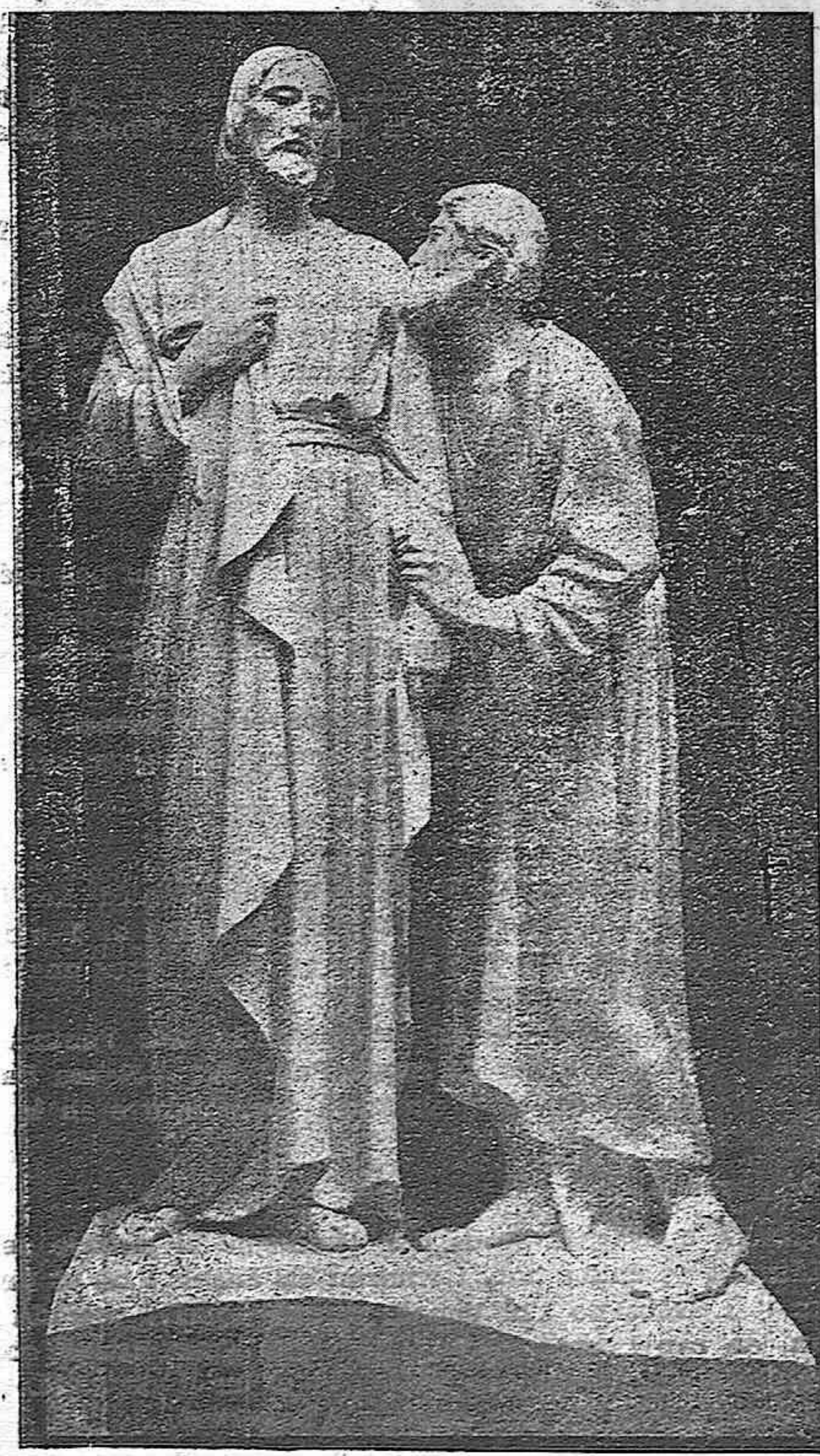
El Beso de Judas :: Composición escultórica de José Limona, custodiada en el Colegio de los Hermanos de las Escuelas Cristianas