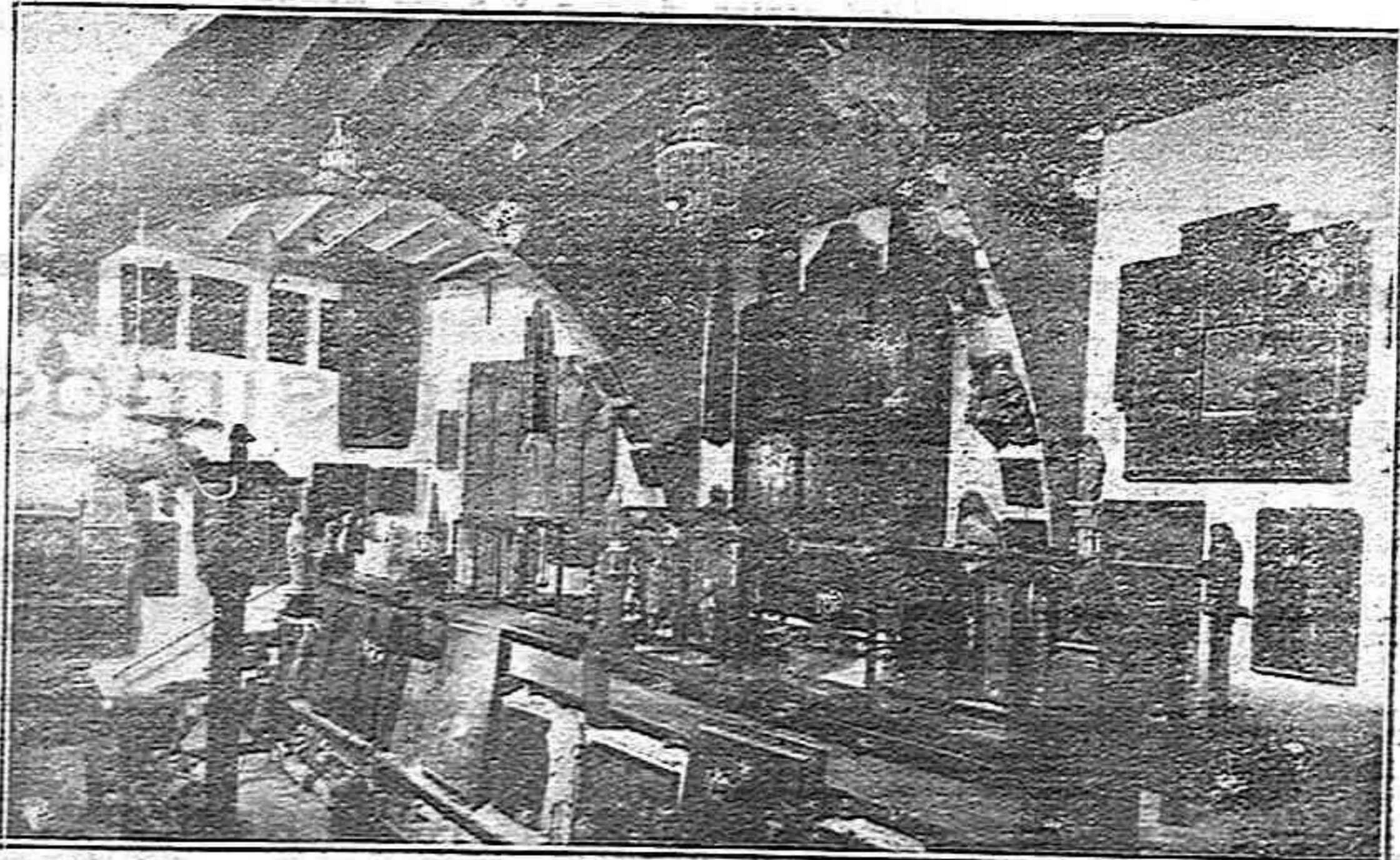
Una de les sales del Museu Diocesà

La primera empresa a que dedicà la seva portentosa intel·ligència, fou la de restituir a la seva original puresa, les fonts documentals del Dret antic romà civil i canònic, que abans de la invenció de la impremta estaven tan plens d'errors que hi havia una veritable