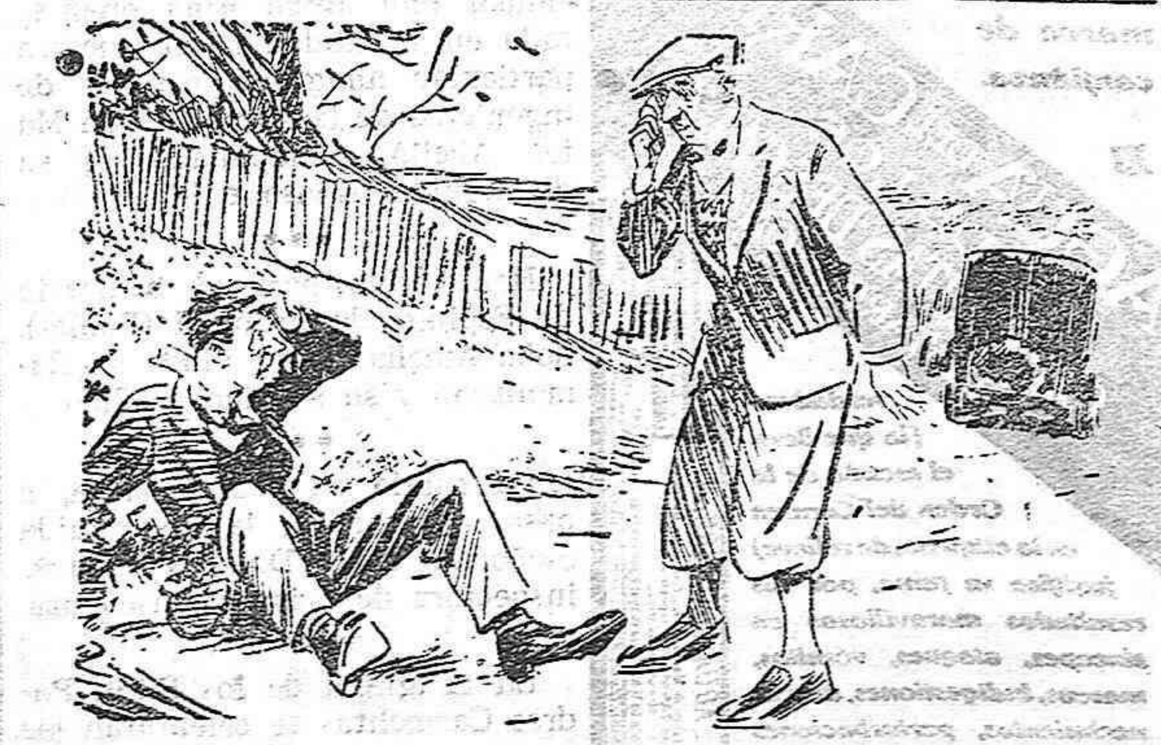
L'atropellat: «Perdoni, senyor, vol fer el favor de adiantar-me una quantitat a compte de lo que vull demanar en judici en reparació de danys i perjudicis?»

En una palabra, la señora de la casa labradora debe sentir la grandeza y la alteza de su misión