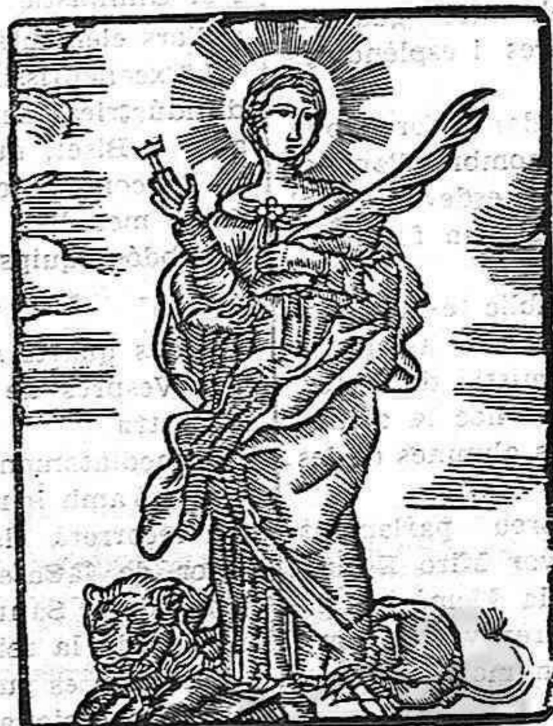
Santa Tecla, Verge i Màrtir

Divendres de les IV Tèmpores de Setembre