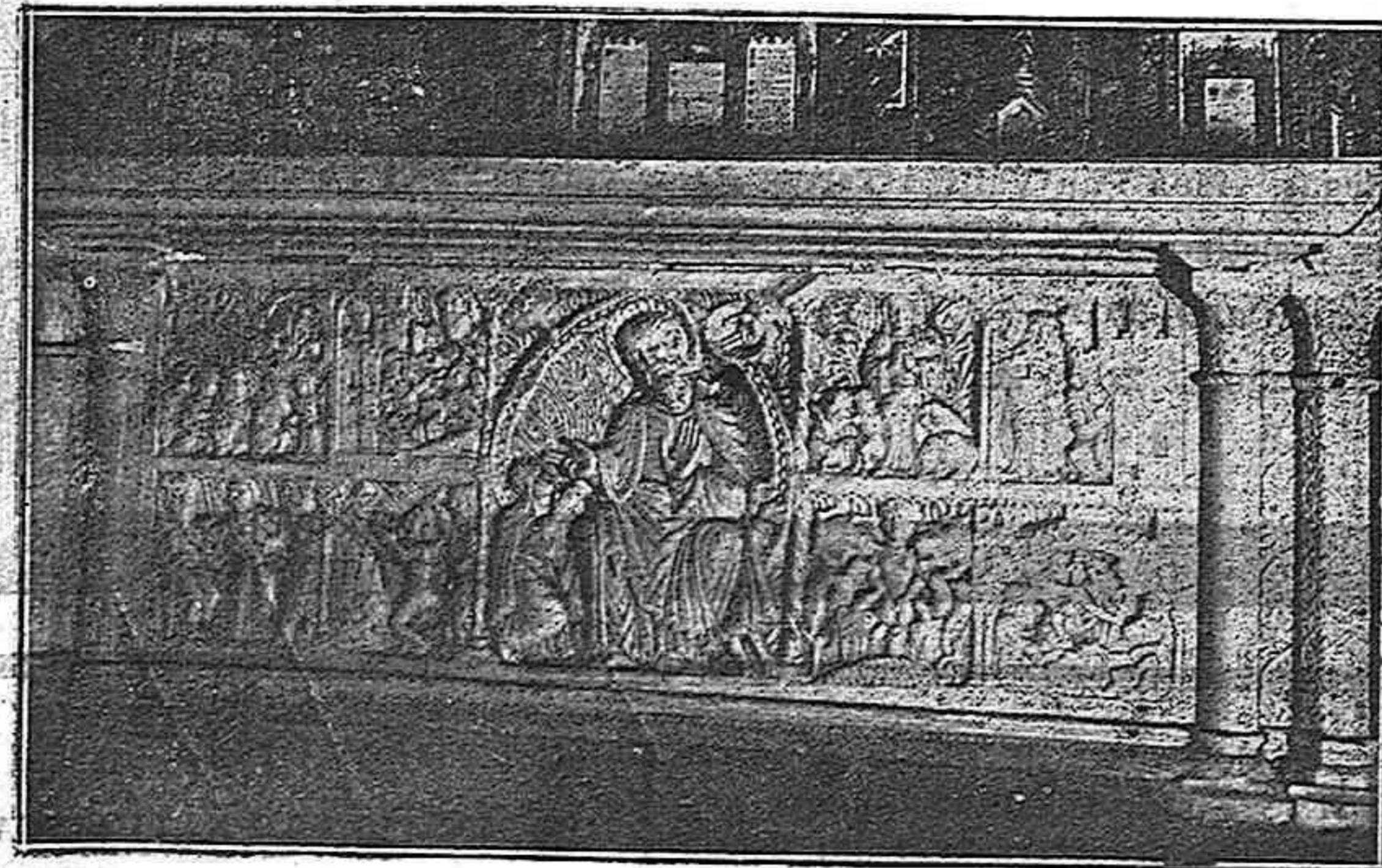
Antependi de l'altar major de la Catedral de Tarragona