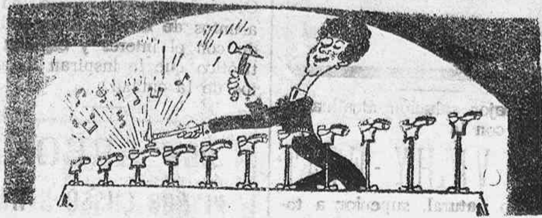
El tocador de tímpana práctico (sic).