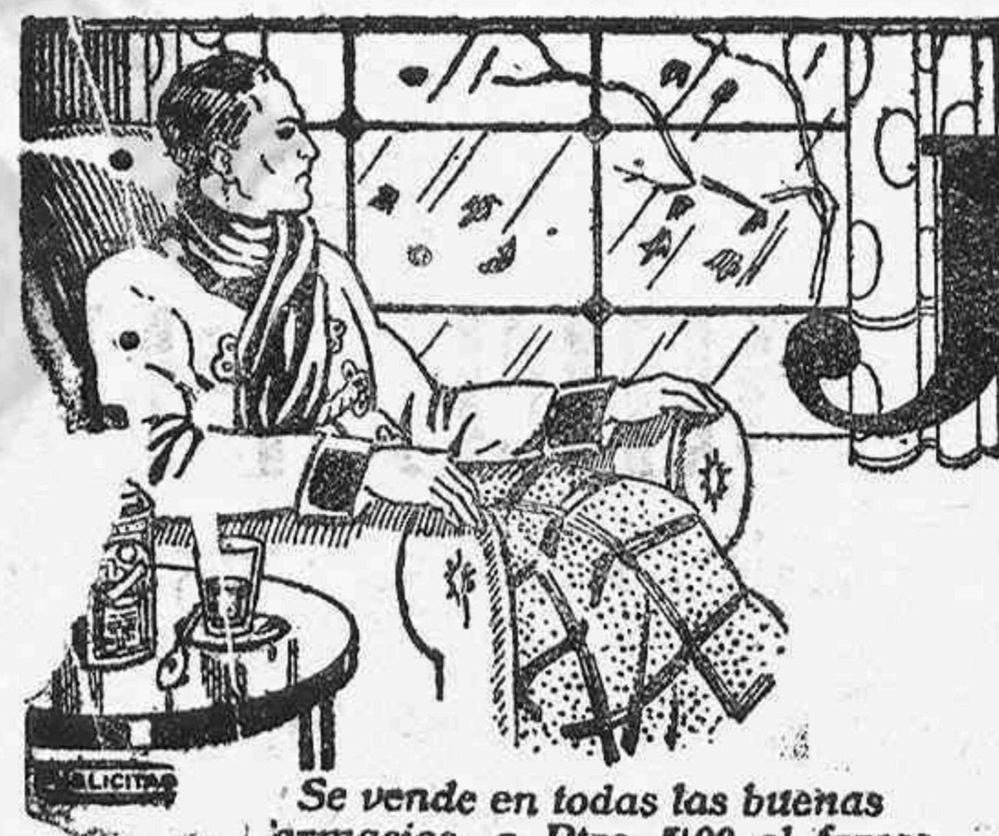
Se vende en todas las buenas farmacias, a Ptas 5'00 el frasco

Visita en Valls todos los miércoles de 9 a 12.