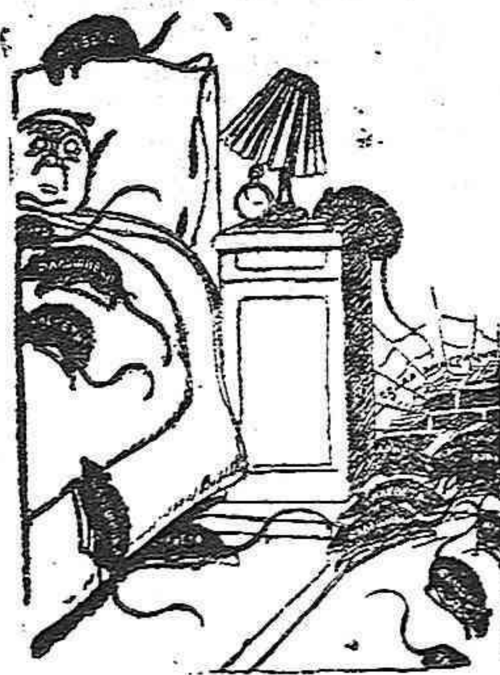
CANVI DE SISTEMA —Com se coneix que ja no'm deixó les sabates al peu del lit.

Y las colgaduras en los balcones y las iluminaciones no sólo en las calles del tránsito de procesión, sino en toda la ciudad, formarán el digno complemento de fiesta tan señalada y pondrán de manifiesto que la Tarragona de hogaño no desmerece de la de antaño, cuando se trata de honrar a nuestra Madre y Señora María Inmaculada.