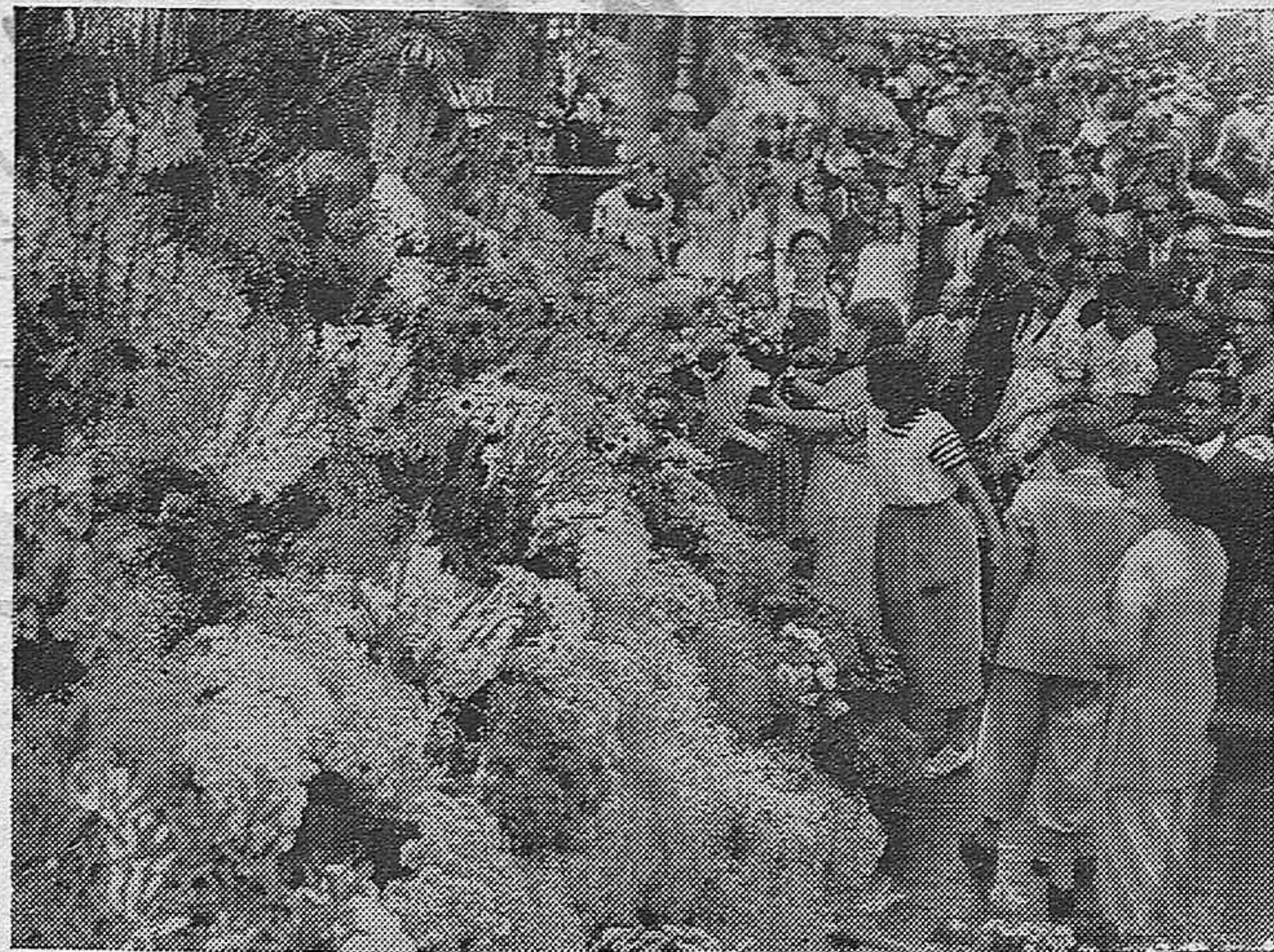
El domingo por la noche, organizado por el Patronato de la Rambla de las Flores, tuvo lugar el V concurso de hortensias y albahacas en medio de una gran animación. Una de las paradas que tomó parte en el concurso.