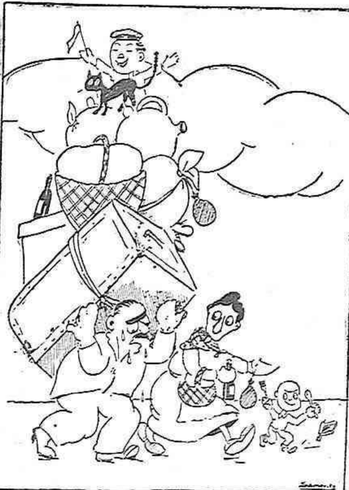
¡Ay, Paca, que bien sienta un día de holganza!