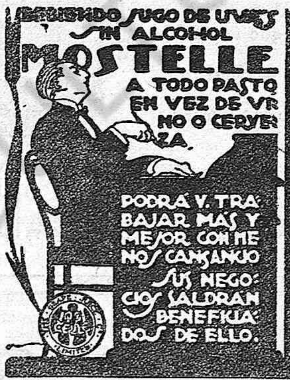
RAFAEL ESCOFET. — Tarragona

El texto del presente número ha sido sometido a la previa censura gubernativa