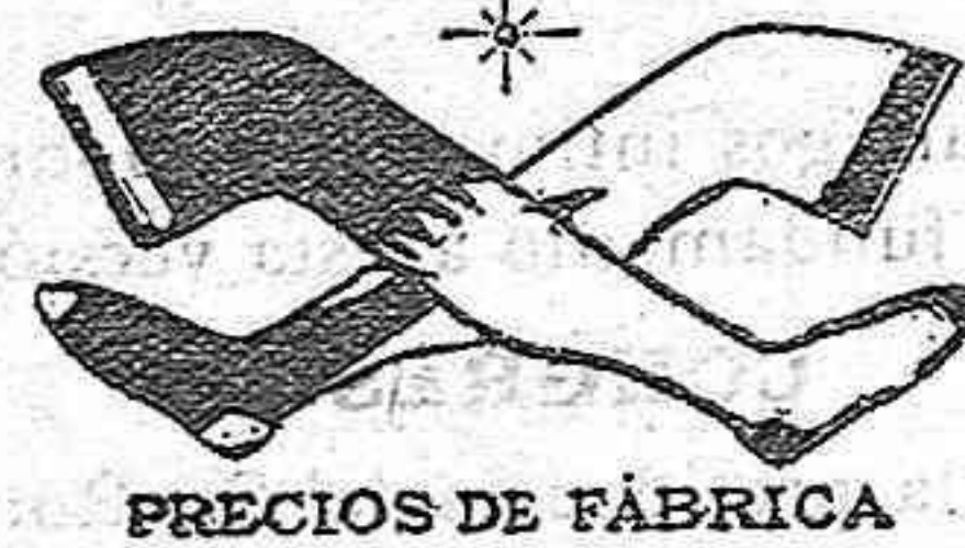
PRECIOS DE FÁBRICA