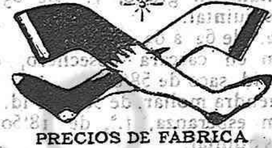
PRECIOS DE FABRICA