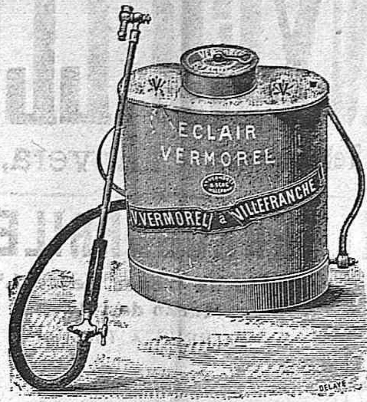
Pulverizadores Vermorel ptas. 50.