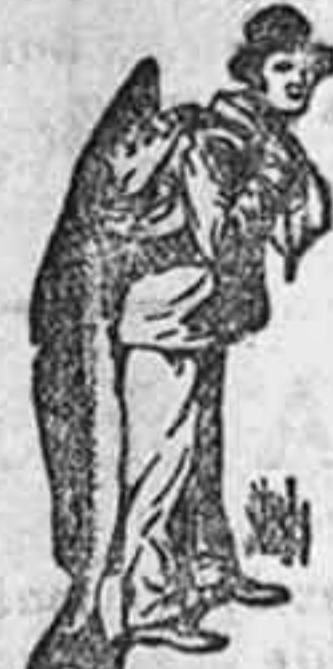
Obténgase siempre la Emulsión con esta marca "El Pescador", marca del procedimiento Scott!