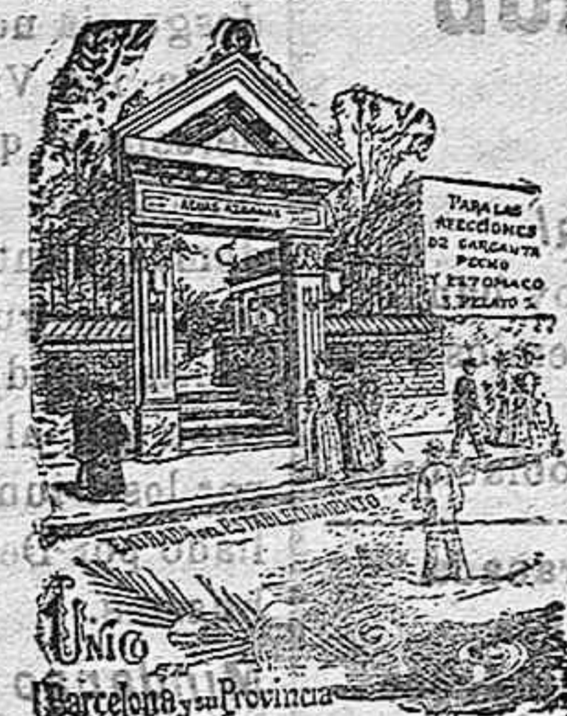
Unico establecimiento en Barcelona

Las aguas azoadas son el medio más seguro rápido y eficaz que la ciencia aconseja y la práctica ha demostrado, para curar el catarro nasal agudo y crónico, la laringitis y faringitis catarral y granulosa, las bronquitis ó catarro bronquial agudo y crónico, el asma, bronquial cardiaca y enfisematosa tuberculosa de las vías respiratorias, lesiones del corazón por exceso de funcionalismo, las dispepsias