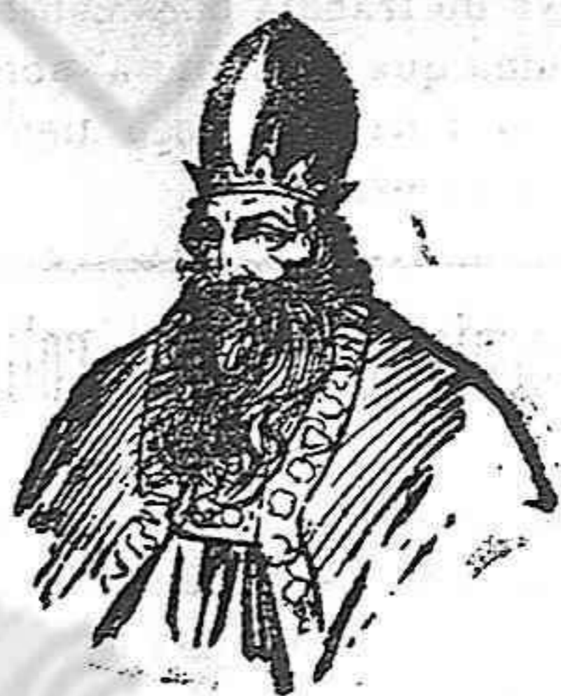
Maatirologio: SAN LINO.

Este santo fué elegido por el Señor para suceder a San Pedro como Vicario suyo.