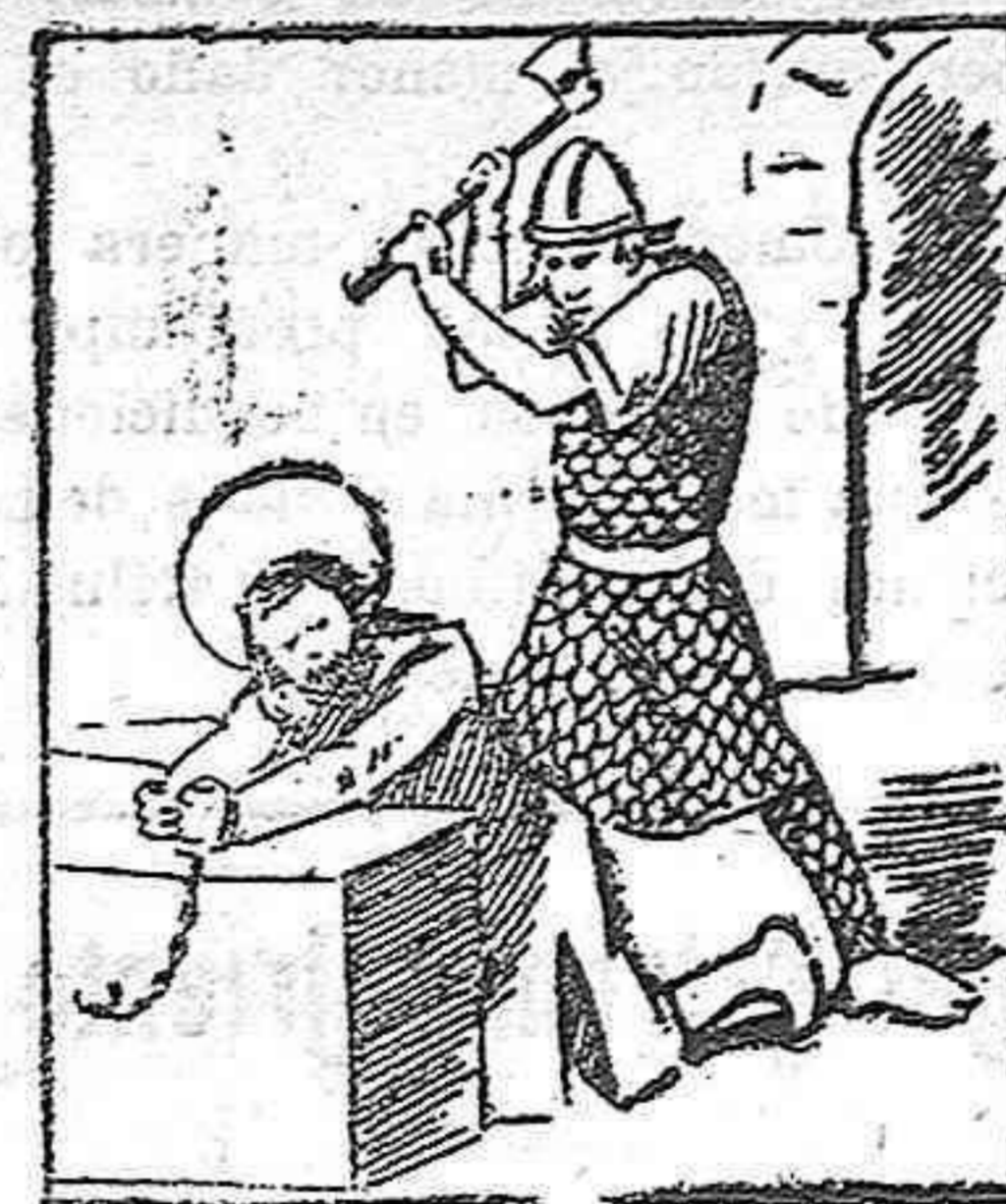
Martirologio: SAN HERMENEGILDO

Era Hermenegildo hijo del rey visigodo Leovigildo y uno de los príncipes arrianos que más se distinguieron por su espíritu cristiano. Conocedor su padre de las santas ideas que el hijo profesaba emprendió una cruel persecución contra los cristianos, alcanzando también á Hermenegildo que fué inmediatamente aprisionado. No pudiendo el rey reducirlo á sus consejos ordenó se le atormentase, lo que se ejecutó, decapitándolo después de la noche del Sábado Santo, 13 de Abril de 586. Hállase su cuerpo en Sevilla, excepto la cabeza que fué llevada á Zaragoza.