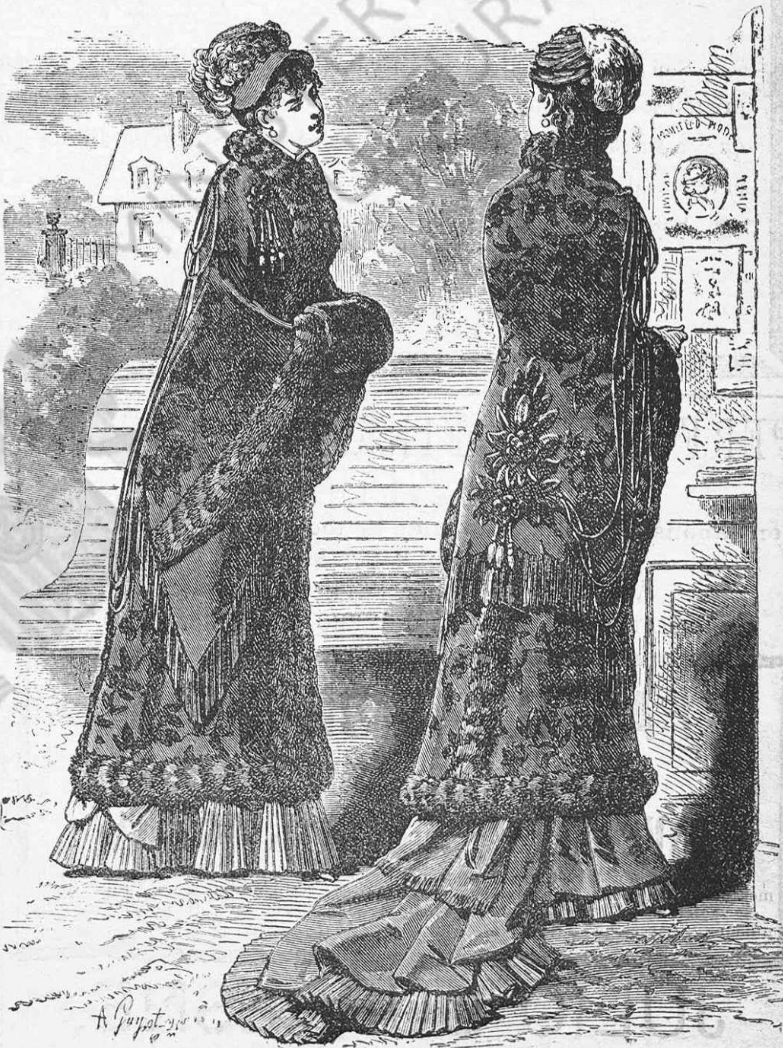
Vestit de carrer.