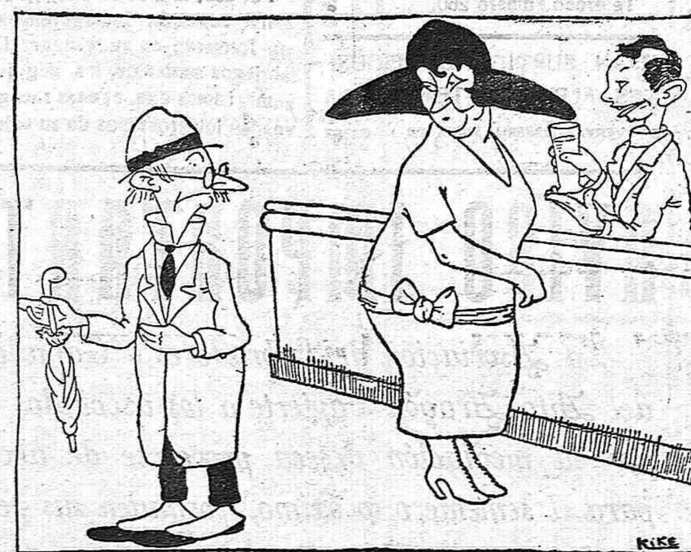
Las solteronas: ¿Qué, no, señorita? A mí no me pesca usted con una caña...