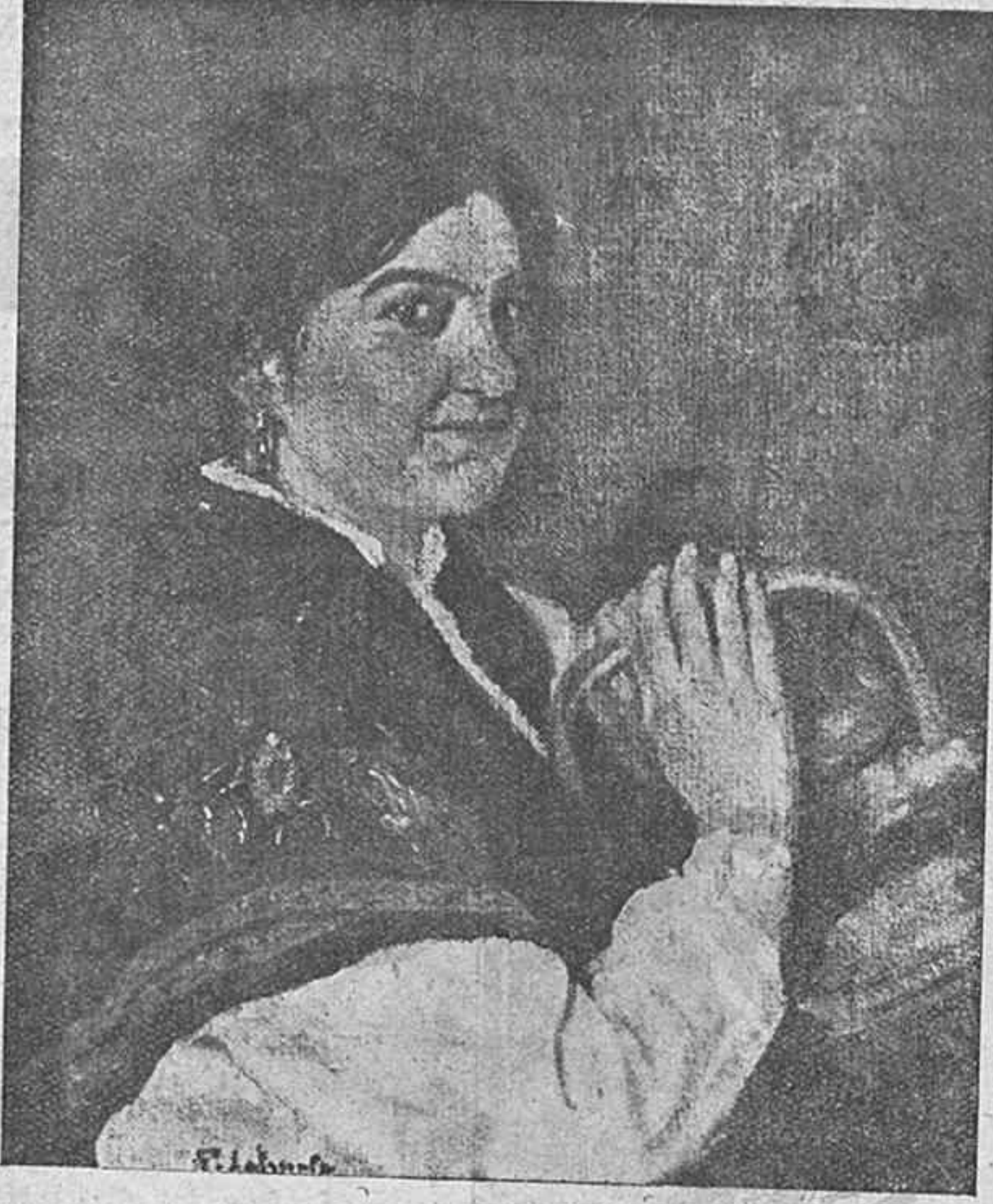
La Dolores (óleo)