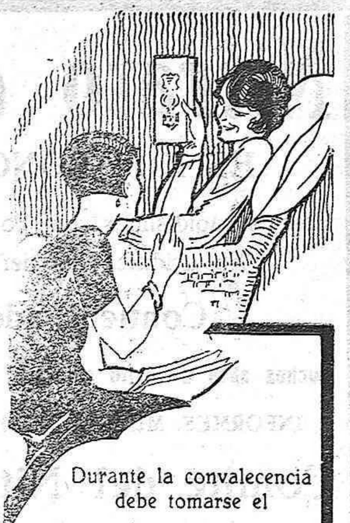
Durante la convalecencia debe tomarse el

En la Compañía y Parroquias, los cultos correspondientes a los Jueves Eucarísticos en las misas de siete y ocho.