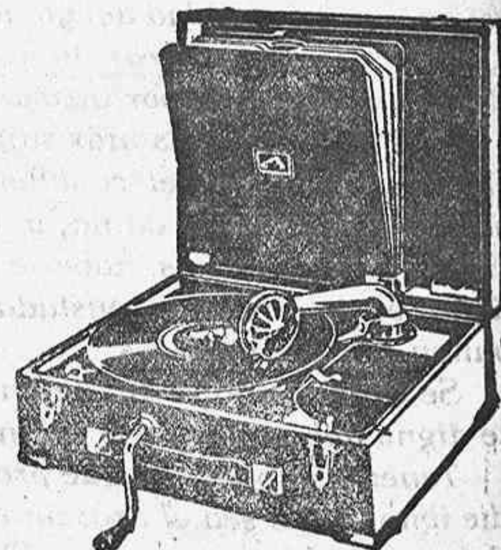
GRAMOLA, 210 ptas.

Relojes pared y bolsillo a precios muy baratos