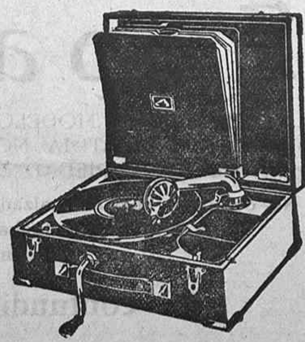
GRAMOLA, 210 ptas.

hay establecidos precios económicos a base de marcas de reconocido nombre