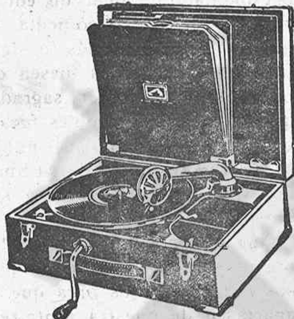
GRAMOLA, 210 ptas.

hay establecidos precios económicos a base de marcas de reconocido nombre