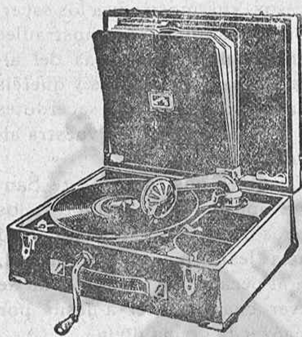
GRAMOLA, 210 ptas.

hay establecidos precios económicos a base de marcas de reconocido nombre