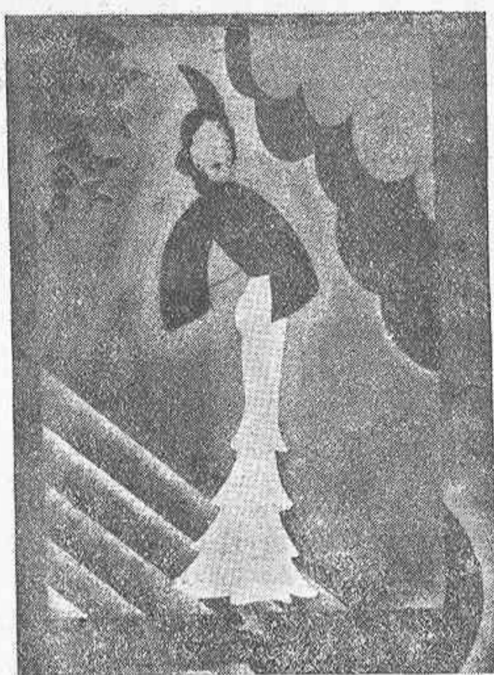
«NIÑA BIEN», por Mata