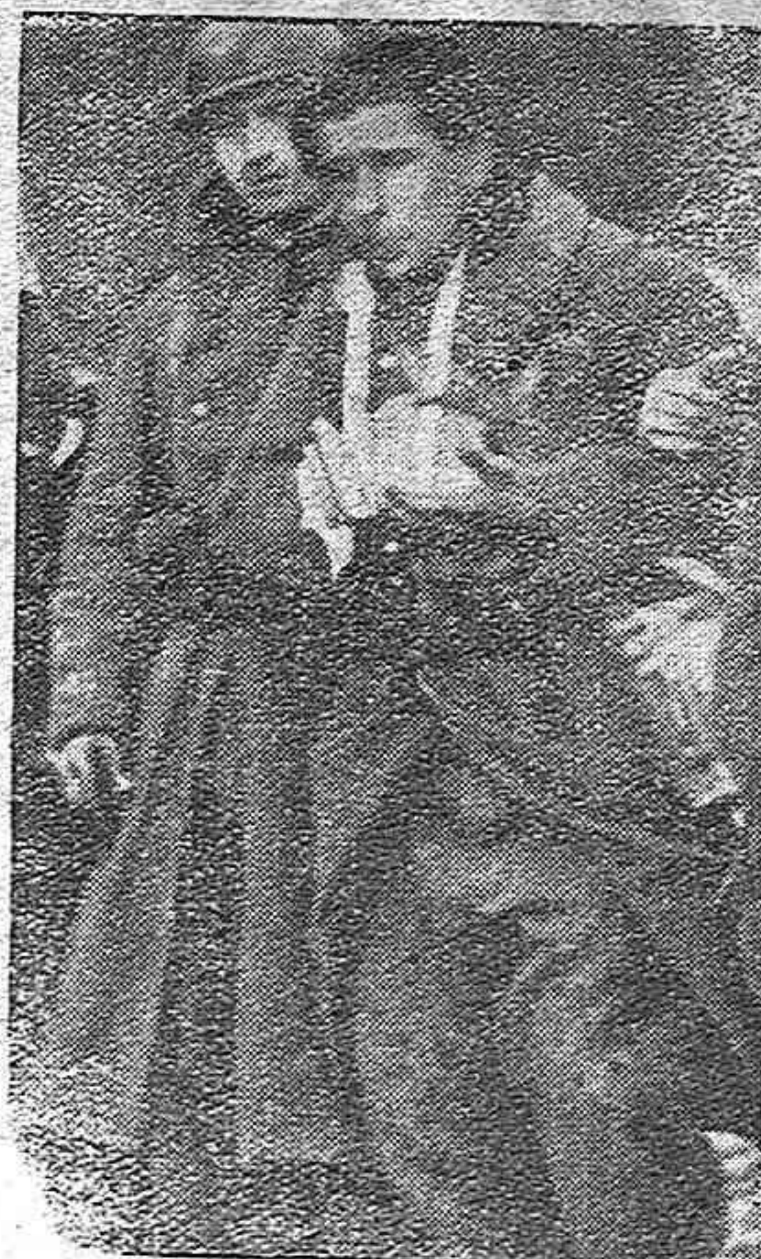
Etica de guerra germánica. El enemigo herido y vencido en leal combate es atendido con la solicitud que requieren las leyes de una humanidad verdadera

Tokio, 5.—El Ministro de Negocios Extranjeros ha decidido exigir la libertad de todos los japoneses detenidos en Londres, Singapur, Rangoon, Hongkong, etc., exigiendo asimismo garantías contra este tipo de acciones.—Efe.