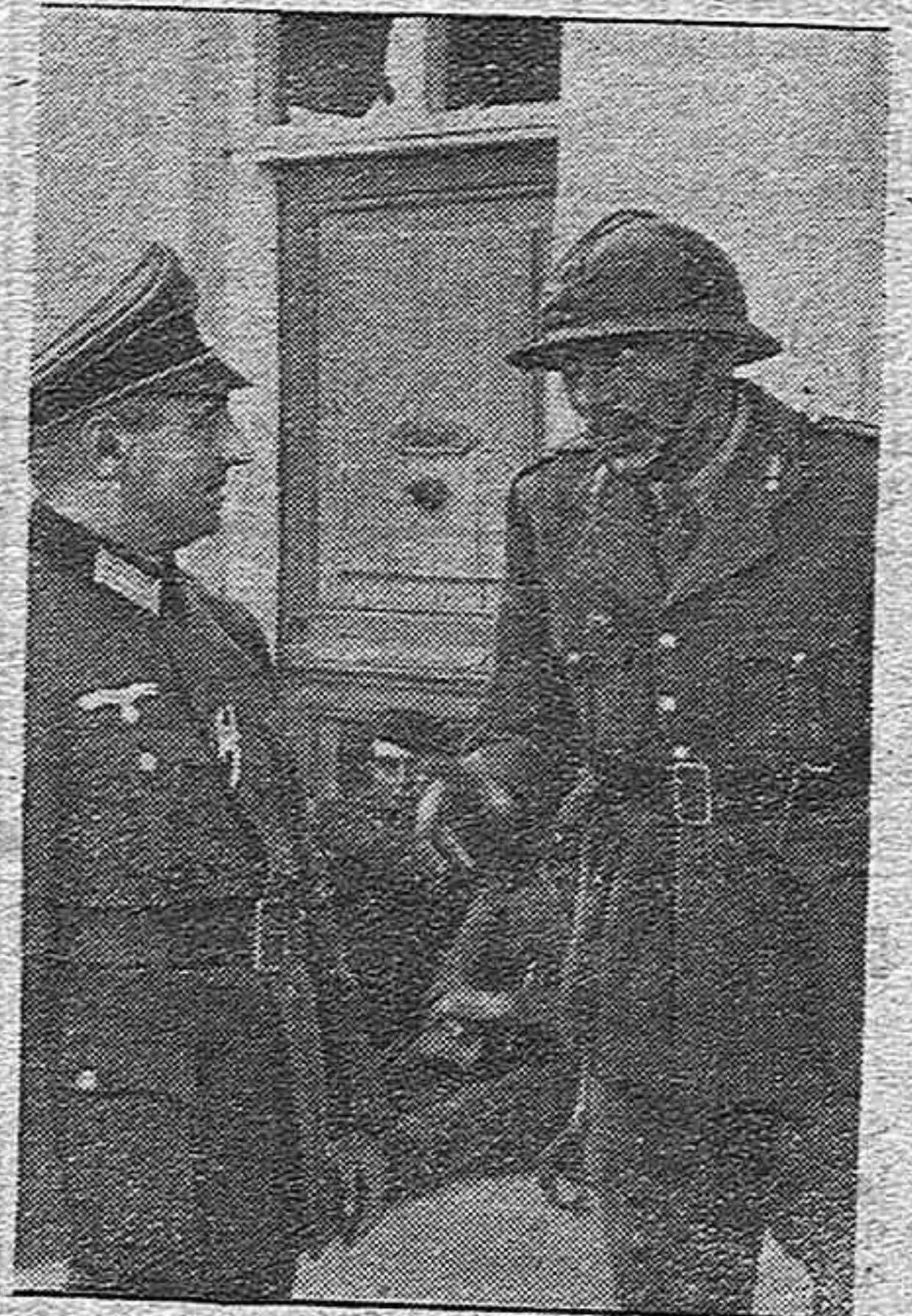
Un oficial francés prisionero expresa a otro alemán su asombro ante la rápida prosecución del avance alemán

Londres, 5.—El comerciante japonés Mahiara que el viernes pasado fué detenido en Londres, ha sido puesto en libertad.—Efe.