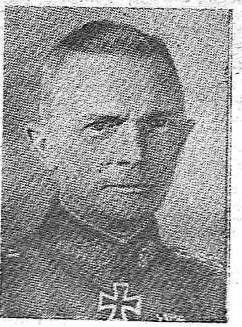
LIST y BOCK ascendidos recientemente por el Führer a Mariscales de Campo