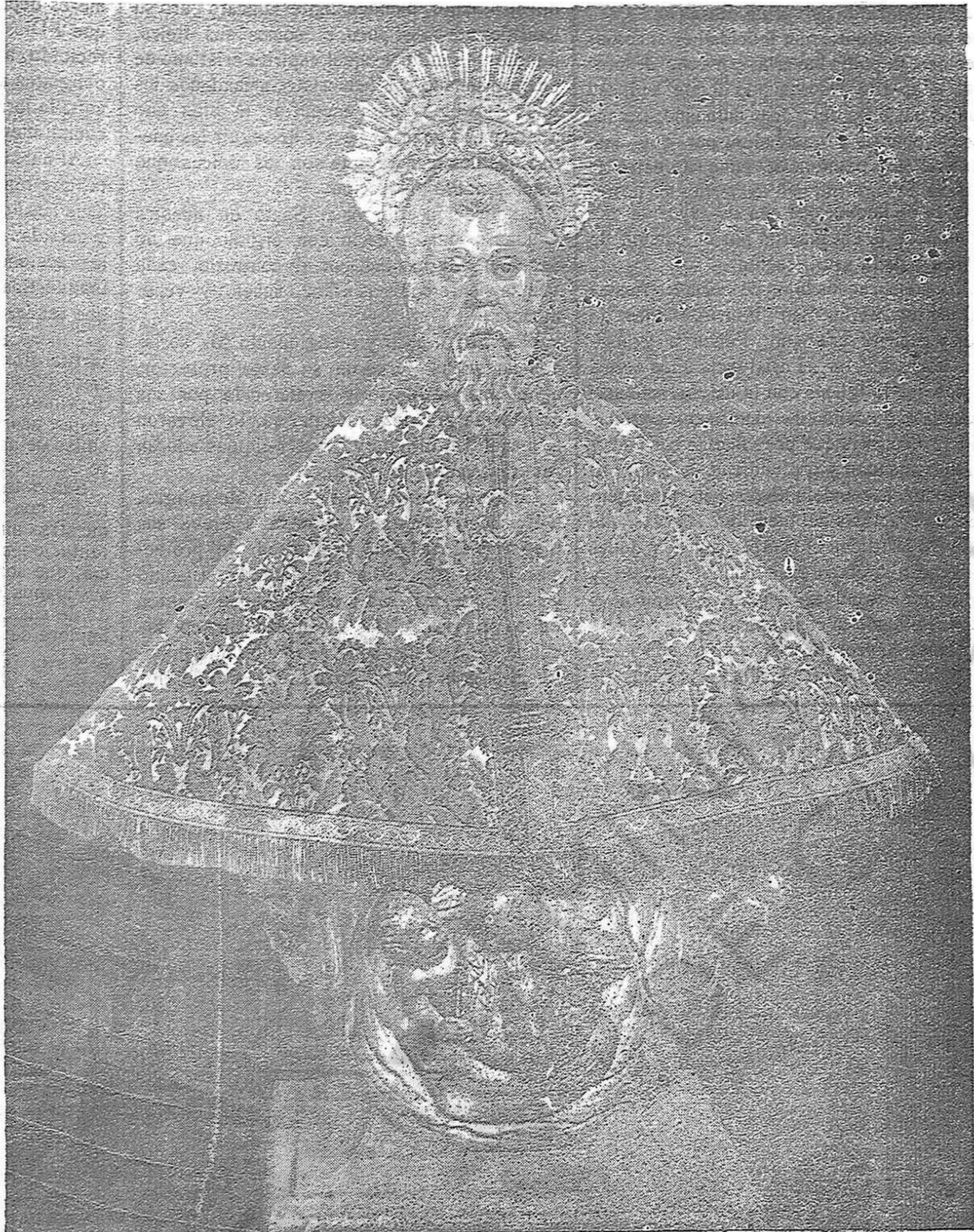
Capa y Corona que por iniciativa de NOTICIERO DE SORIA fué adquirida por suscripción popular en el año 1926

San Saturio vivió en la pobreza y abrazó la virtud, se despojó de todos los bienes que dió a los pobres, se retiró del mundo, de sus pompas y vanidades y en la soledad de la cueva, mortificó sus pasiones con la oración y la penitencia. Imitaremos pues al santo bendito de nuestros amores, dando limosnas al pobre desvalído y necesitado? ¿Nos acordaremos de los pobres que son nuestros hermanos, amándoles y obedeciendo a ese deber moral que nos impone el sacrificio de la caridad? ¿Hemos pensado en la inversión que hacemos de los bienes de fortuna, cuando los empleamos en cosas superfluas y necesidades viciosamente creadas, nunca permitidas en la sana moral cristiana, por que los bienes corresponden a los pobres indigentes, los que nosotros debemos de socorrer cuando acuden implorando nuestra protección y auxilio? Meditémoslo y si hallamos aquí la debilidad y flaqueza humanas deserta del camino que el Señor nos trazara, procuremos la enmienda que repare los desvios y consigamos aquella vida de sacrificio que lo elevó a la santidad.