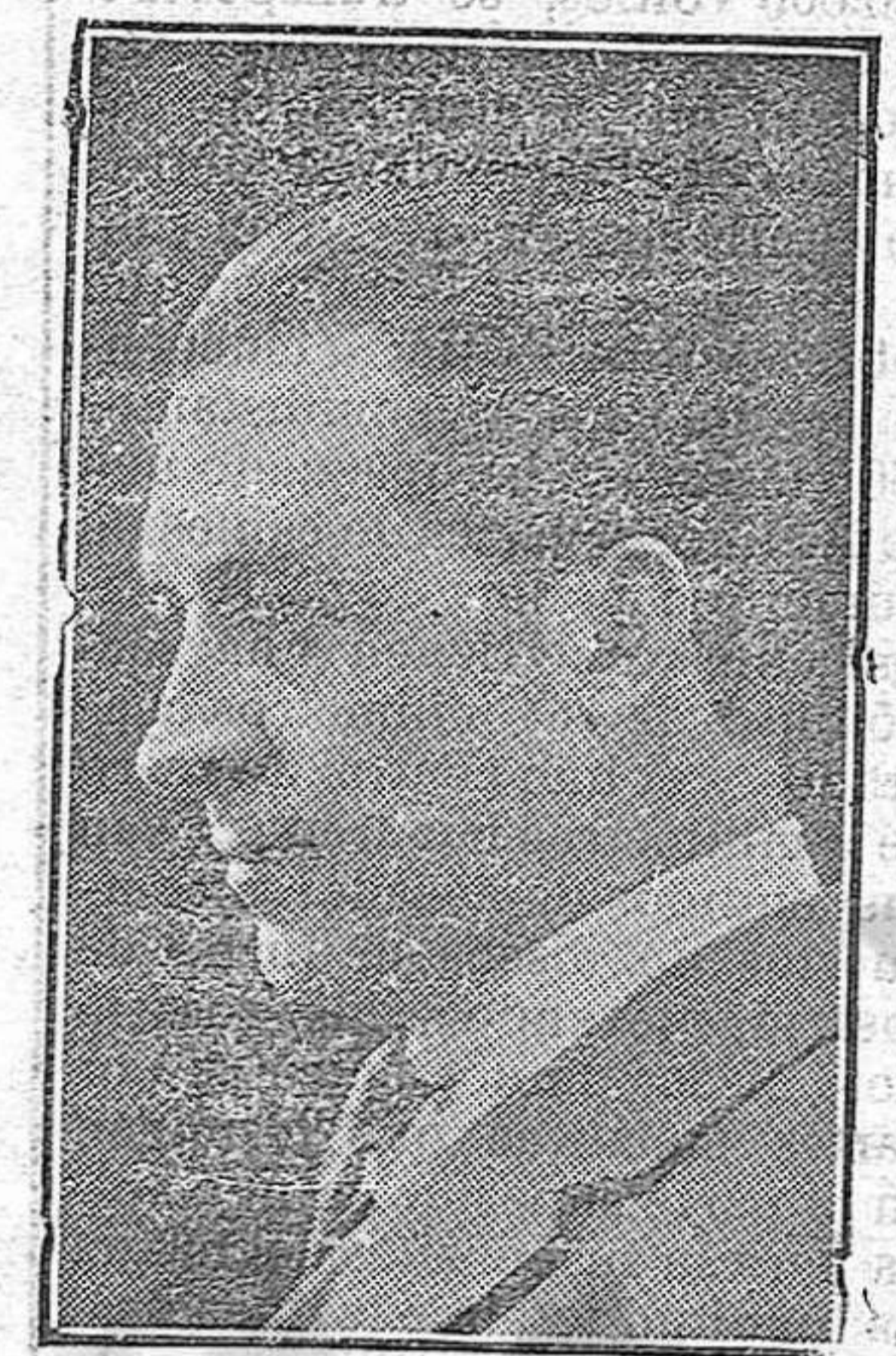
El famoso guitarrista D. Francisco Calleja

En los programas que esta tarde y esta noche ofrece el célebre artista, figuran composiciones de positivo valor artístico y de enormes dificultades técnicas. Sabemos que el Nocturno de Chopin es una filigrana, una maravillosa revelación en manos de Calleja.