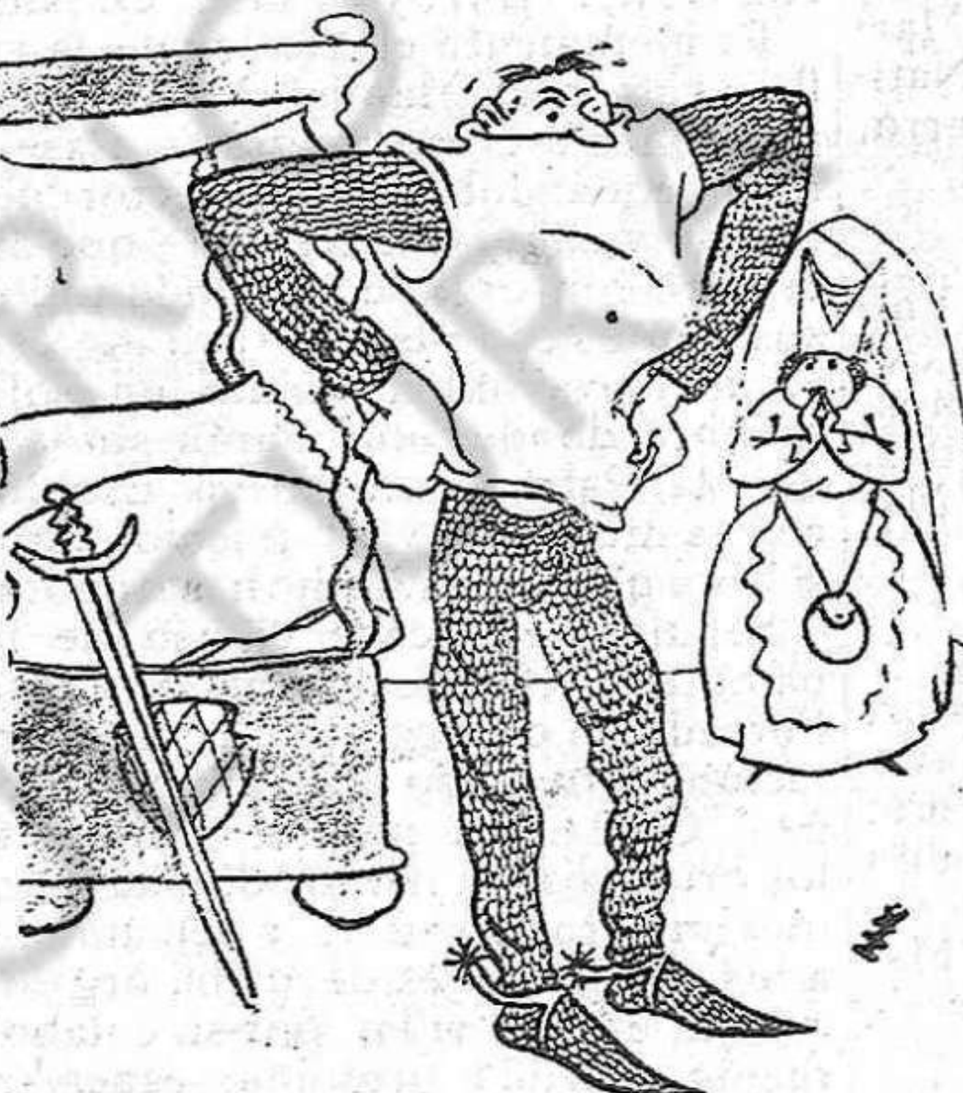
El caballero varigudo que trata de quitarse la coraza