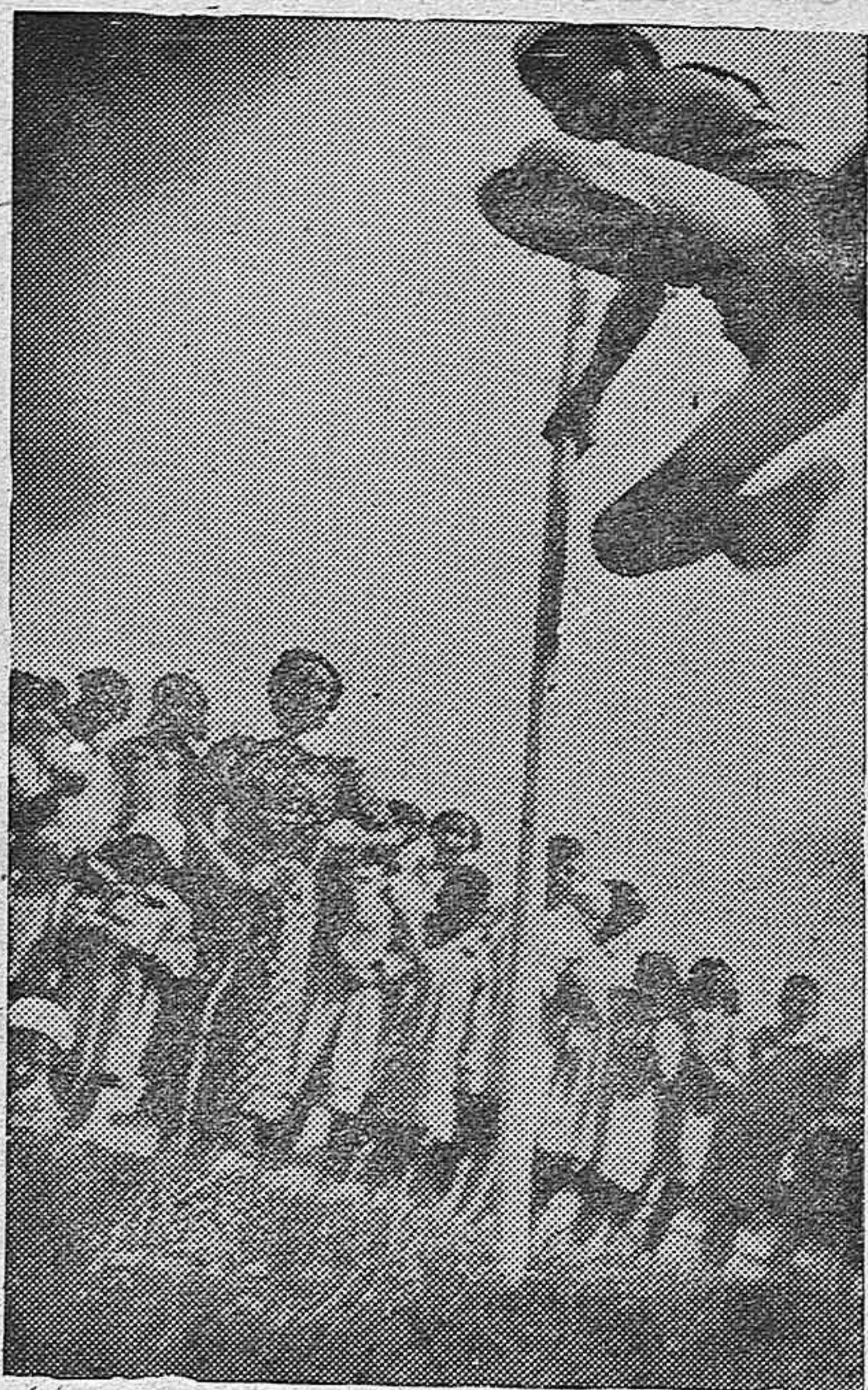
El amor al deporte en las Organizaciones Juveniles se cultiva como el mejor medio de alcanzar la alegría y fortaleza del cuerpo