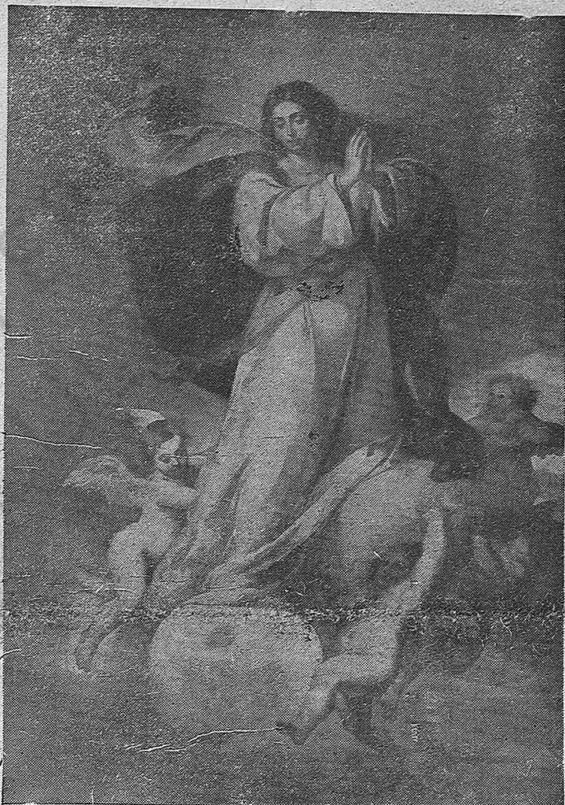
LA INMACULADA CONCEPCION PATRONA DE ESPAÑA Y DE LA GLORIOSA ARMA DE INFANTERIA

Interesa que conozcan en América el hondo sentir humano y justo de nuestra guerra. Nuestro heroico Ejército que ha asombrado al mundo con su valor, su técnica y su disciplina y cumplimiento del deber, está realizando un magno servicio en defensa de la civilización universal. Nuestro Alzamiento no buscó nunca el medro personal de nadie y la defensa de una clase social, sino que trató tan sólo de impedir que se aniquilara a la Pa-