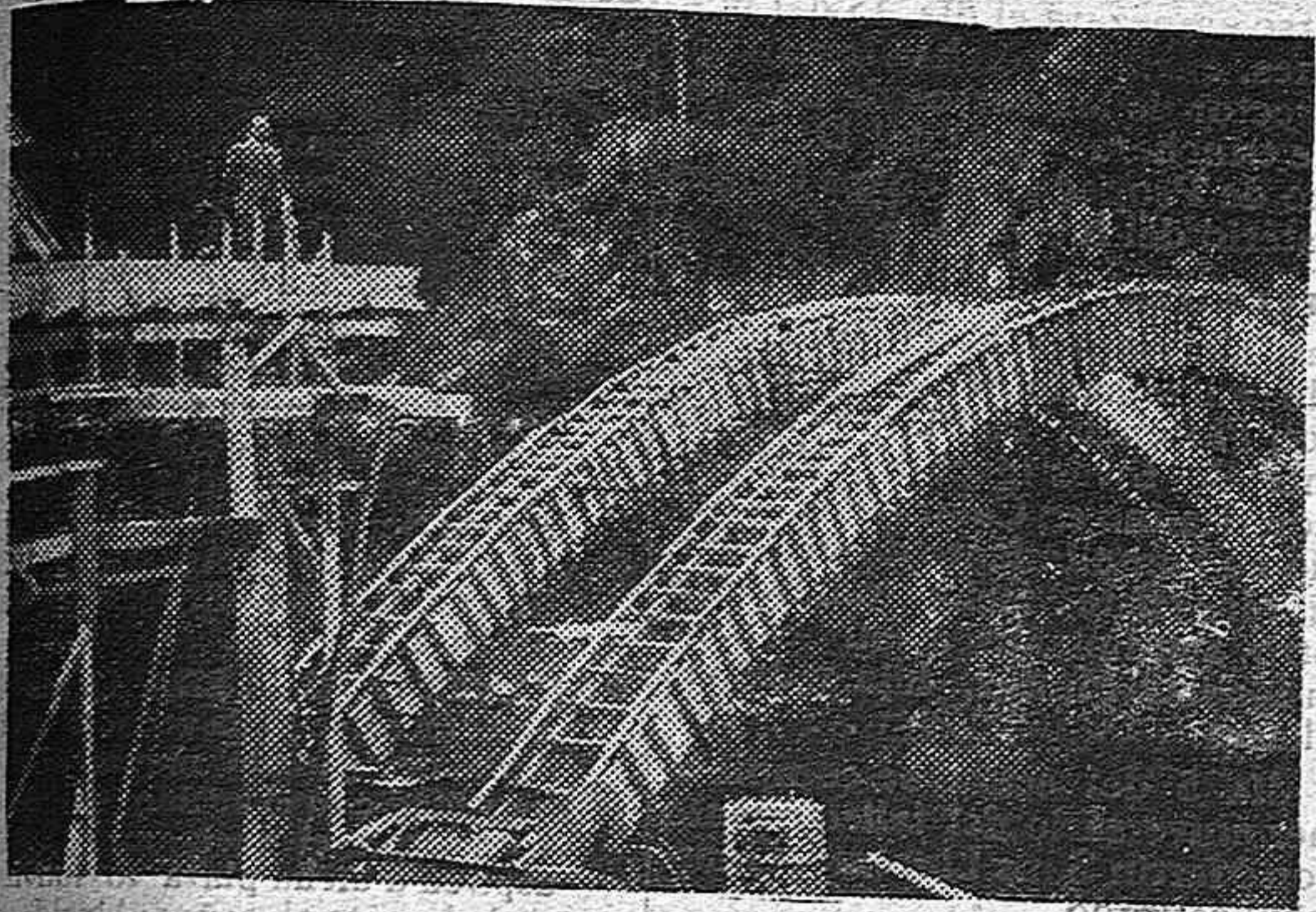
En la Ruta de Guerra del Norte, se ofrecen a los ojos de los excursionistas casos como el del hermoso puente metálico de Badarlaza que fué bárbaramente destruido por los rojos y que nuestros Ingenieros reconstruyeron con su singular rapidez y maestría. La presente foto recoge unos momentos de aquella obra.

Después de esta recepción los distinguidos viajeros se trasladaron a San Sebastián, donde oyeron misa. A mediodía almorzaron en el restaurant del Igueldo.