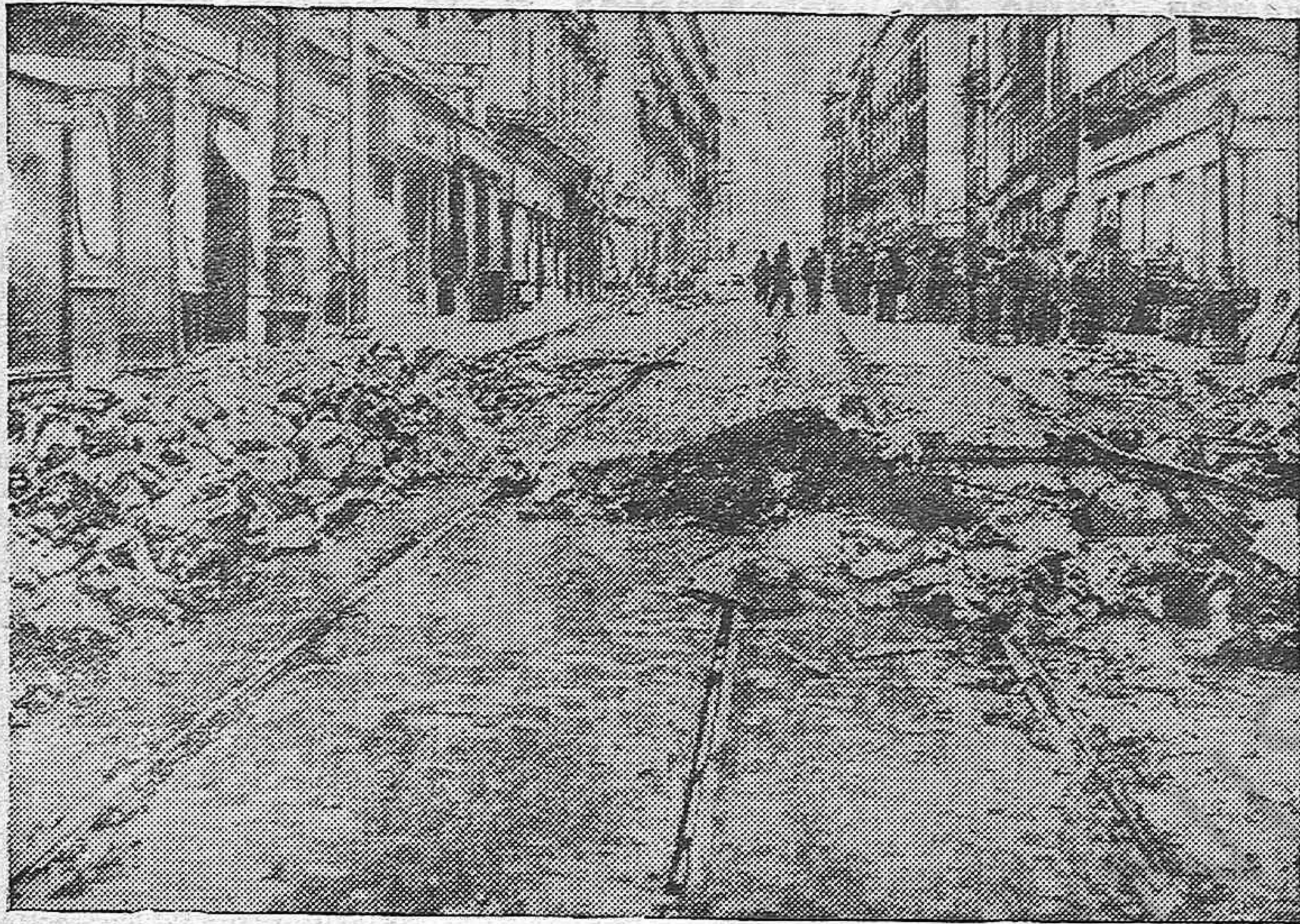
Basura, escombros, desolación en las calles donde pulula el marxismo. Madrid hoy, ha perdido aquella limpieza de ciudad mimada para convertirse en un vaciadero muy a tope con las hordas que allí campean. En esta fotografía aparece una de las primeras arterias de la ciudad, desconocida por su repugnante aspecto y en la que se ve un grupo de personas haciendo cola en la puerta de un comercio. A su alrededor todo es un campo de cochambre y despojos. Esto ha hecho el marxismo de la capital de España. No han podido evitarlo.