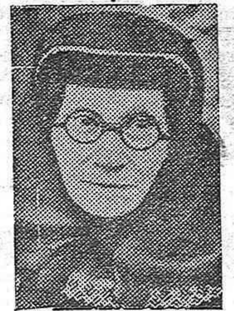
La madre de Stalin que ha muerto en el destierro al que fué condenada por sus ideas religiosas.

A este estado de barbarismo y monstruosidad llegan los soviets. Ni los hijos guardan a sus padres un mínimo de consideración y afecto. Para ellos la familia es un perjuicio burgués. El cabecilla bolchevique se ha debido de creer en el caso de dar tan «maravilloso» ejemplo.