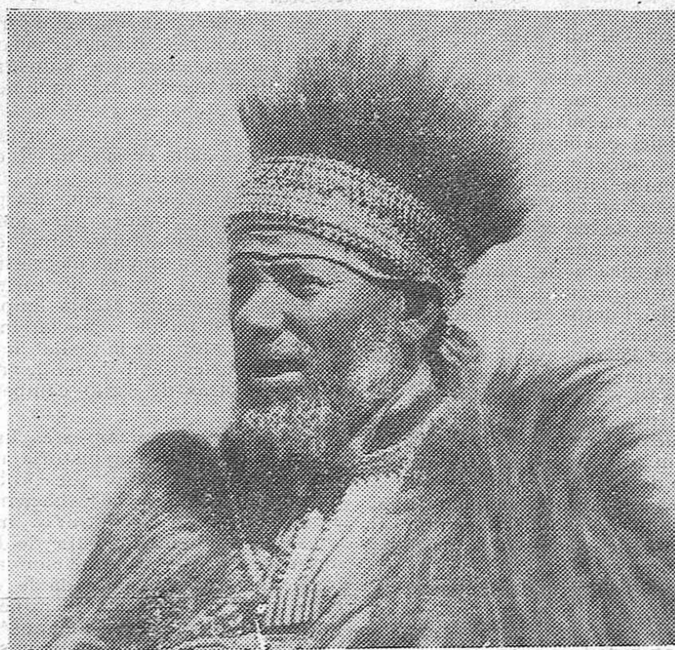
ABISINIA. — El famoso guerrero Fiturari de Arbie, una de las más destacadas figuras del Ejército abisinio.

Roma, 17. — Mussolini y el ministro de Instrucción Pública de Hungría han firmado un convenio cultural de intercambio y mútua colaboración en las cuestiones de enseñanza. El jefe del Gobierno italiano manifestó a los periodistas que este convenio no era más que una expresión de la completa inteligencia que existe entre los dos países en el orden político y económico.