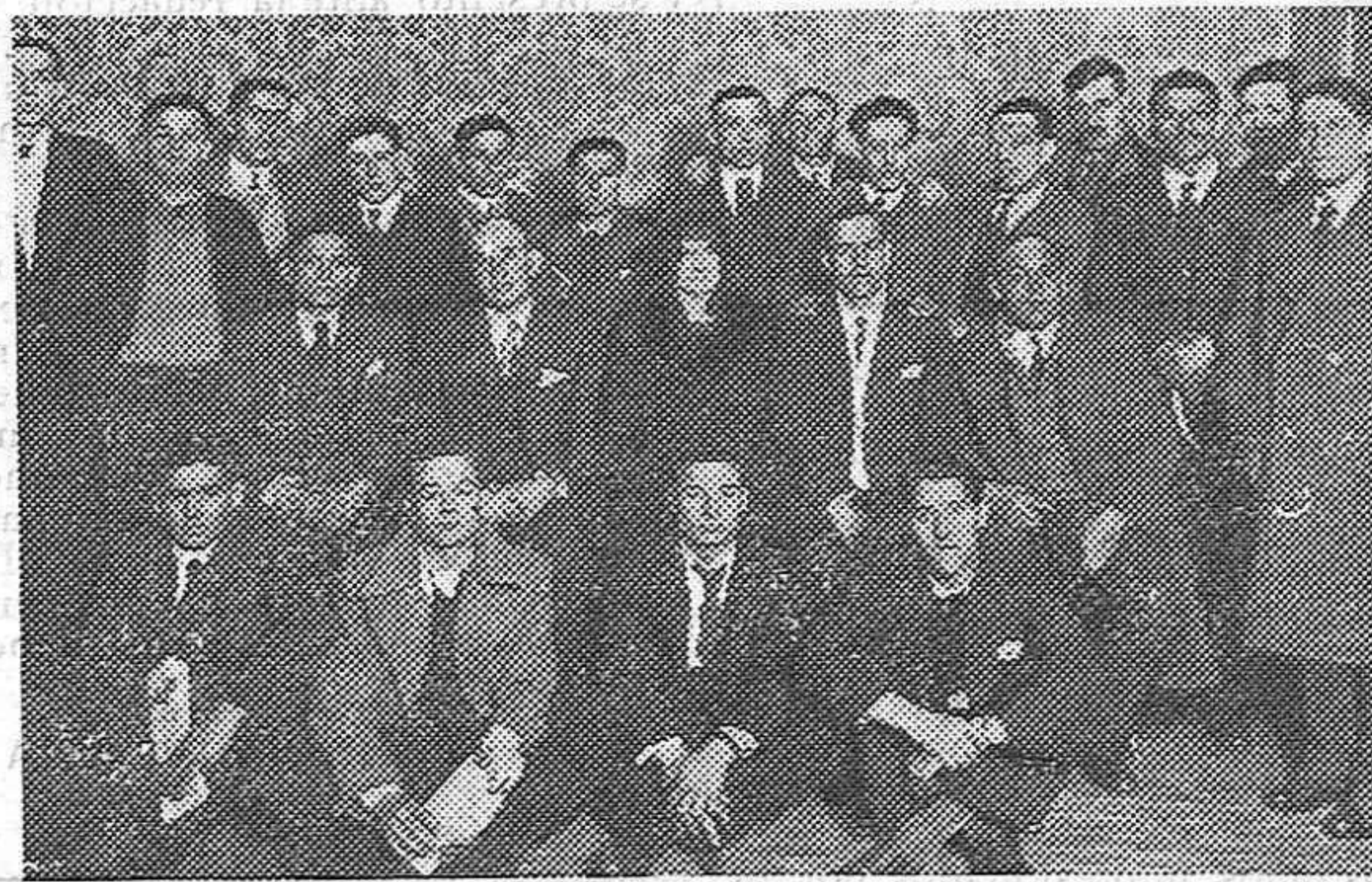
EN EL TEATRO DE LA ZARZUELA.—Los mineros católicos de Moreda, supervivientes de la defensa del Sindicato Católico de Moreda a los que se ha tributado un homenaje. En la foto figura también la heroica mujer del conserje del «Sindicato Católico» de Moreda.

Es indudable que esta campaña, (al igual de la otra emprendida por un diario madrileño) contra el Jefe de la Ceda,