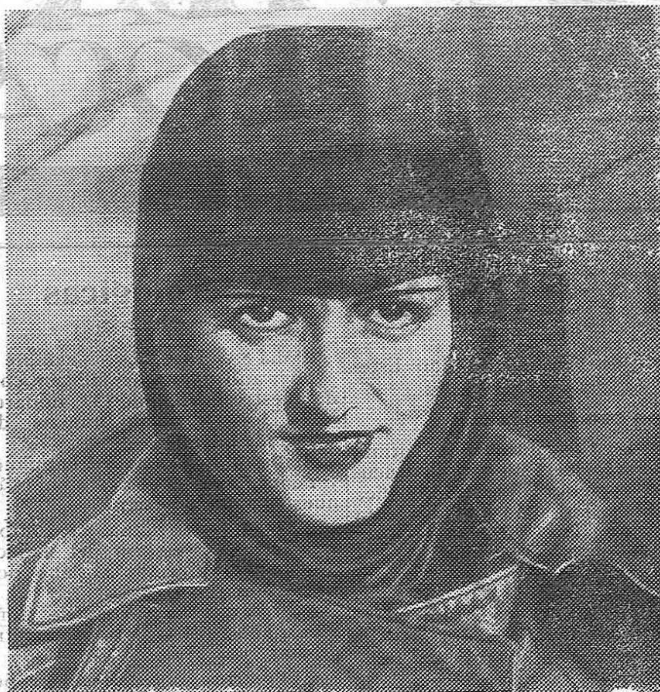
La aviadora francesa Madeleine-CHARNAU la cual, en compañía de Mlle. Clark, ha batido el «record» mundial femenino de altura en avión ligero de primera categoría, consiguiendo elevarse a 6.150 metros.