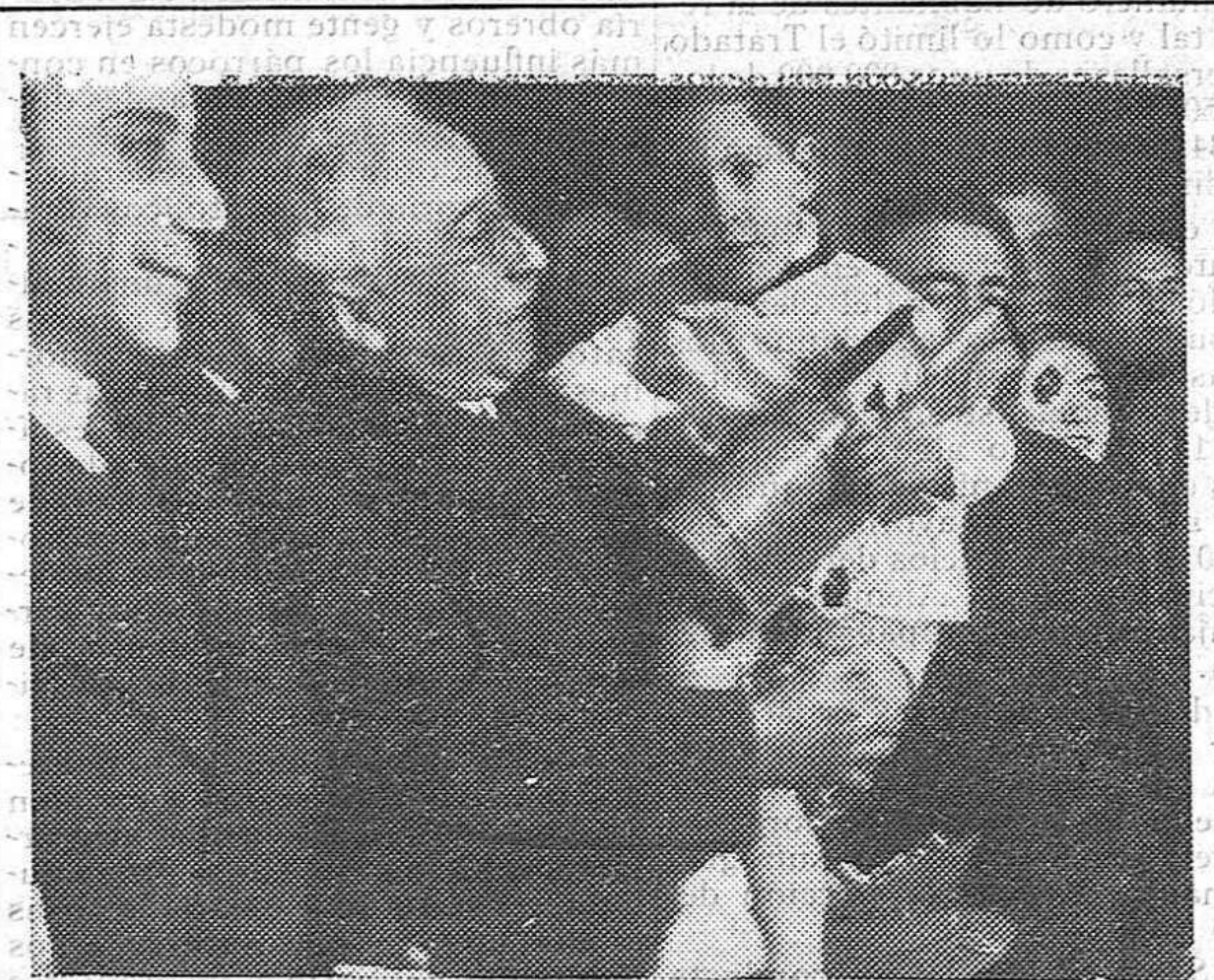
El Presidente de la República sostiene en brazos a un niño de uno de los Grupos escolares, en que presidió los repartos de juguetes el día de Reyes.

Madrid, 10.—El domingo comenzará la campaña sindical del Instituto social obrero; se celebrarán ocho mítines entre Avila, Segovia, Zamora y Burgos. En el mes de enero se celebrarán, en total, veinticuatro actos públicos del I. S. O.