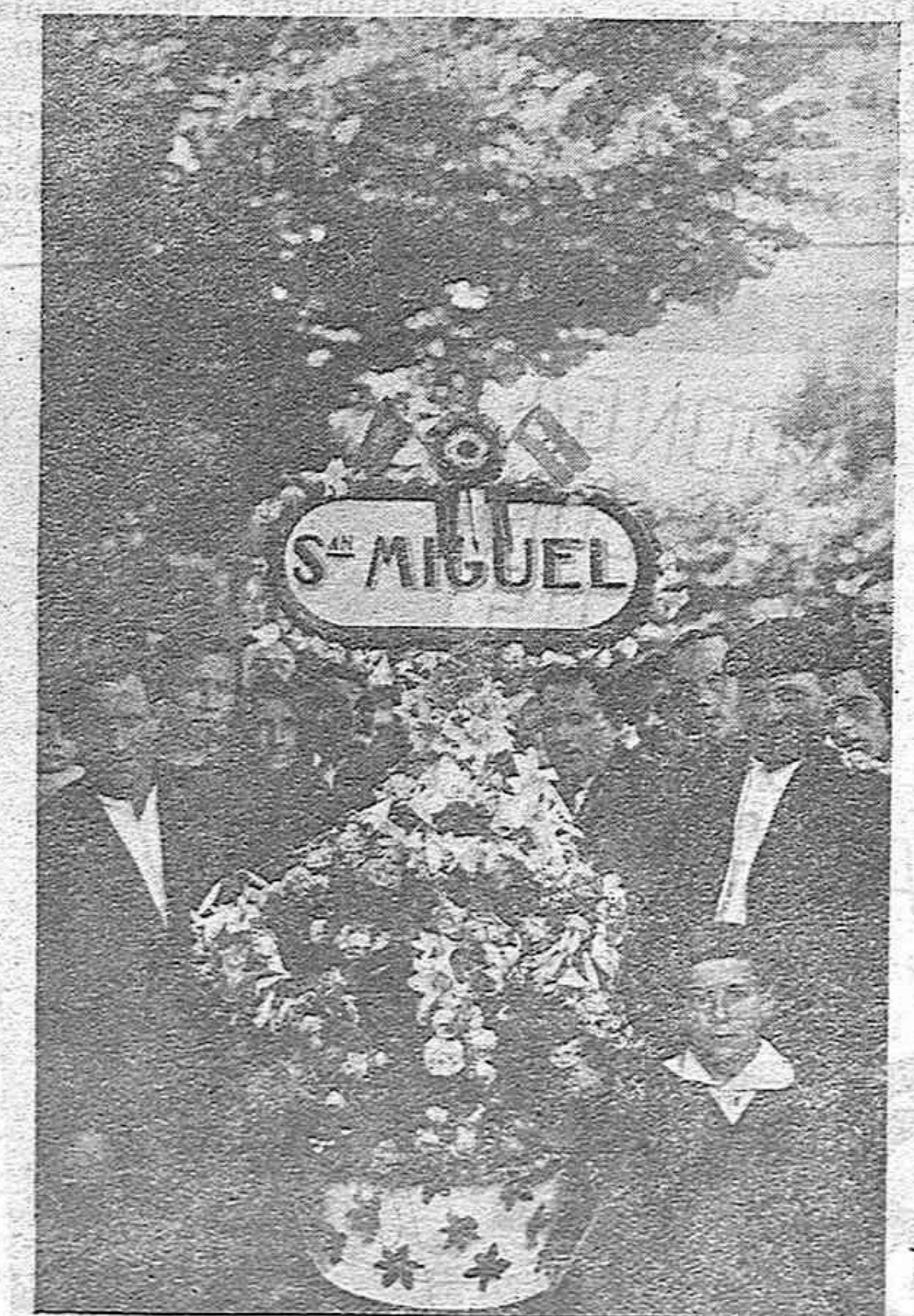
Después de dos años han vuelto las fiestas. Aparece en la fotografía una Caldera ataviada, que en otro tiempo lució en una mañana como la de ayer. Es orgullo de cada cuadrilla, recibir el mejor elogio y la aprobación destacada de las autoridades, que prueban de las doce, instaladas en el paseo de la Alameda y que luego se han de dar fin, en medio de la más franca alegría