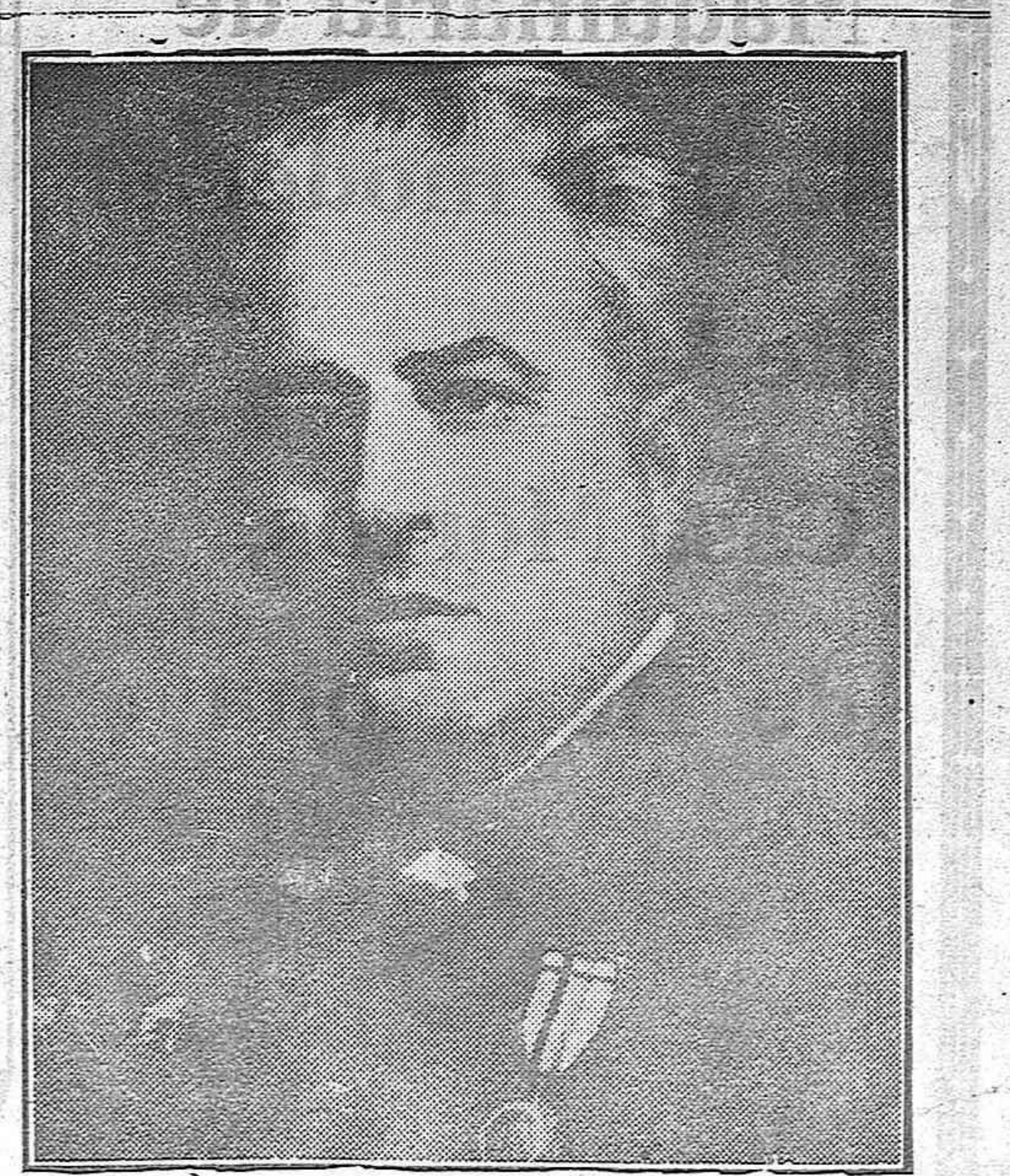
El Glorioso General Yagüe, que el sábado último estuvo en nuestra ciudad. Visitó la Jefatura Provincial del Movimiento interesándose por la marcha de la Organización.

Ginebra.—Como ampliación de la nota del Gobierno Español diciendo su retirada de la Sociedad de Naciones se ha hecho público que España deja de pertenecer también al Tribunal de Justicia de la Haya y al Tribunal internacional del trabajo.