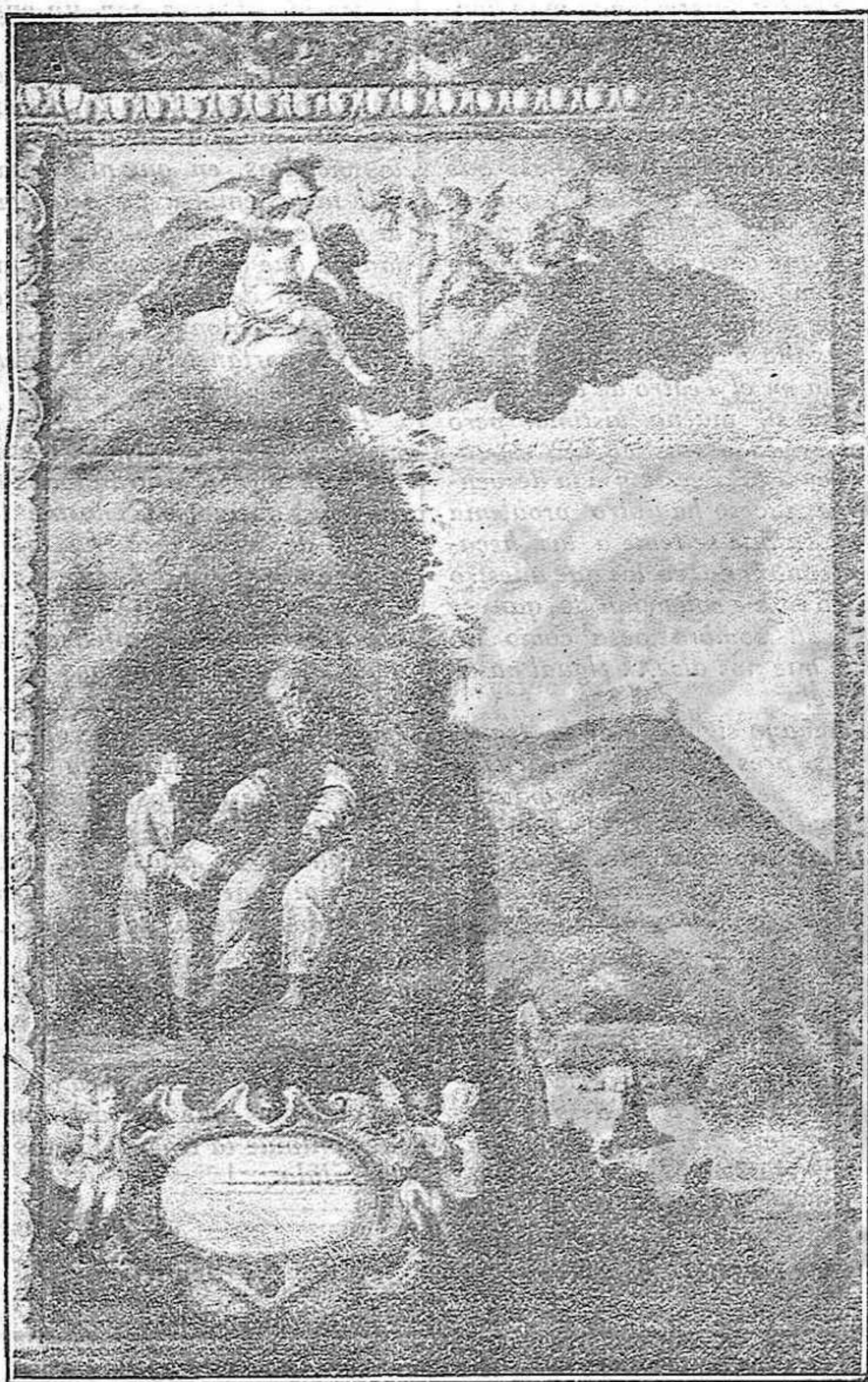
FRESCO DE LA ERMITA DEL SANTO QUE REPRESENTA UN PASAJE DE SU VIDA EREMITICA, Y UNO DE SUS MILAGROS AL RECIBIR A SAN PRUDENCIO.

Es el hijo más grande, más eximio, más ilustre de nuestro país.