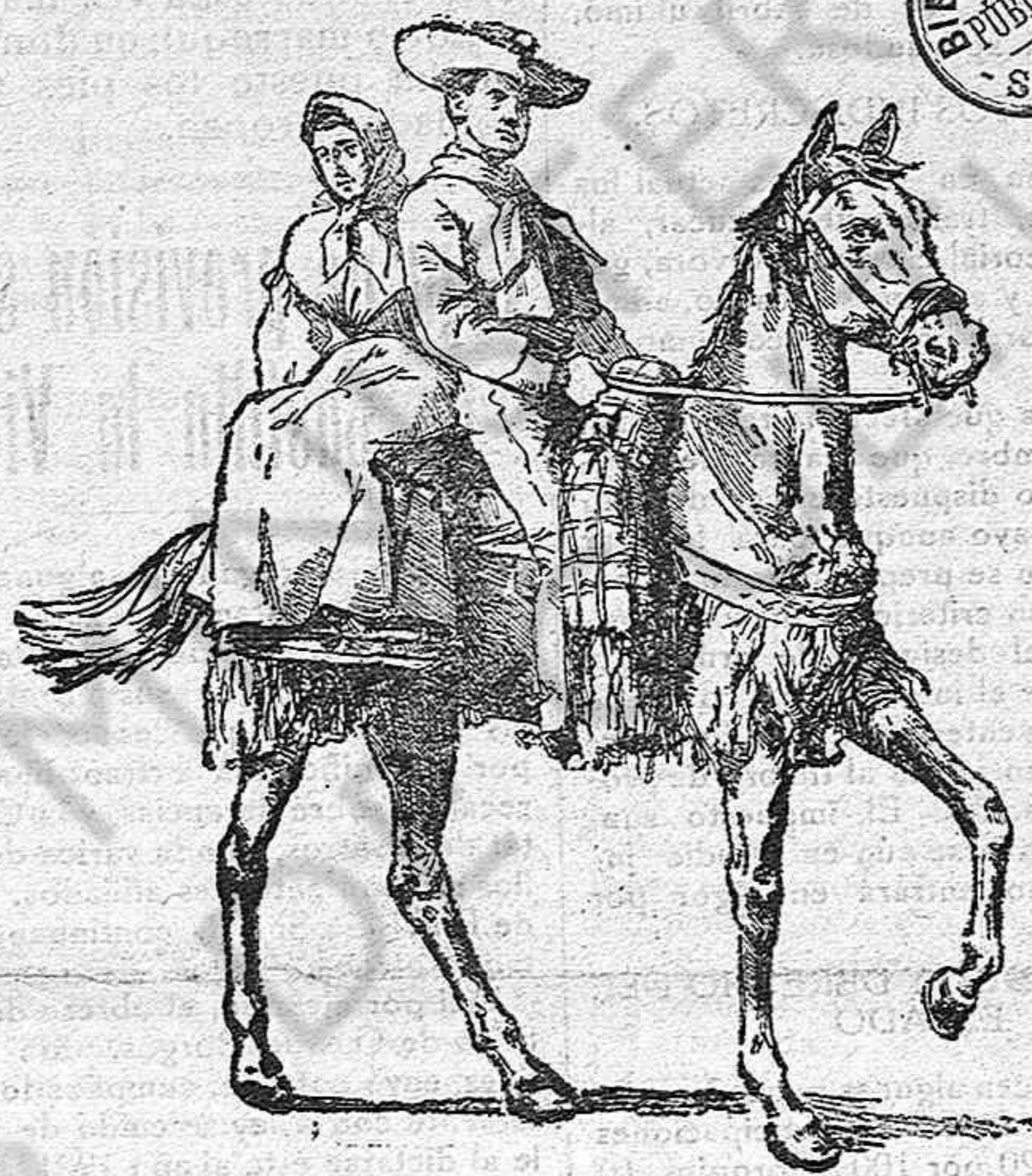
Pareja clásica, en la mejor "marca de automovil,, para esta fiesta