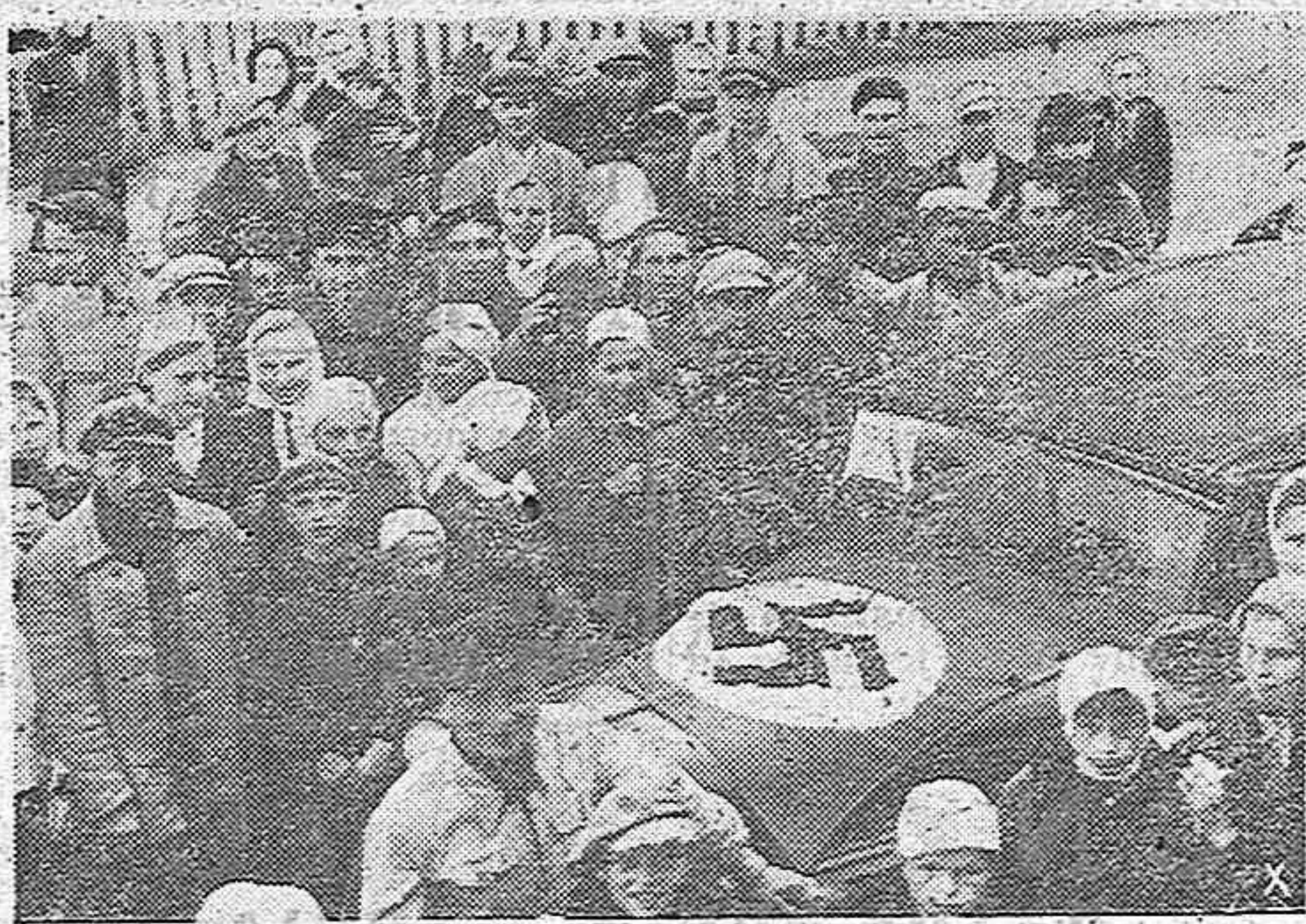
Los habitantes de las poblaciones rusas liberadas del yugo bolchevique reciben a las tropas alemanas y aliadas con gran entusiasmo