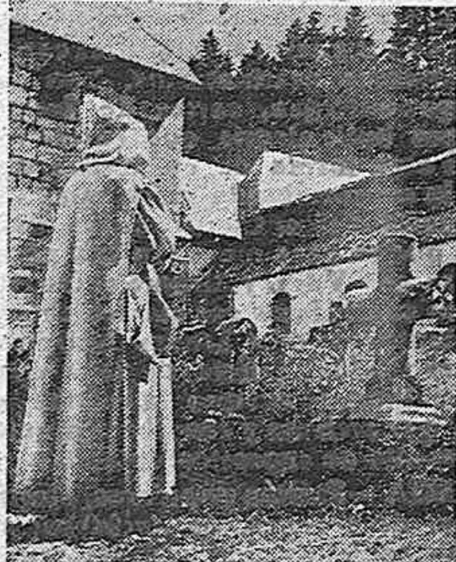
Uno de los patios del Monasterio

Nos referimos a la noticia publicada recientemente por la prensa de todo el mundo, informando que el gobierno del ilustre Mariscal Petain, ha devuelto el famoso Monasterio de la Gran Chartreux a la gloriosa orden Benedictina, a la que perteneció y que en un día trágico, hace poco más de 38 años, fué desalojada por gendarmes franceses, siguiendo la orden del gobierno Combès, entre la consternación general del pueblo de Saint Pierre de Chartreux, que los despedía con lágrimas, como ellos salieron de aquel lugar, deseando vehementemente, unos y otros, volver a encontrarse.