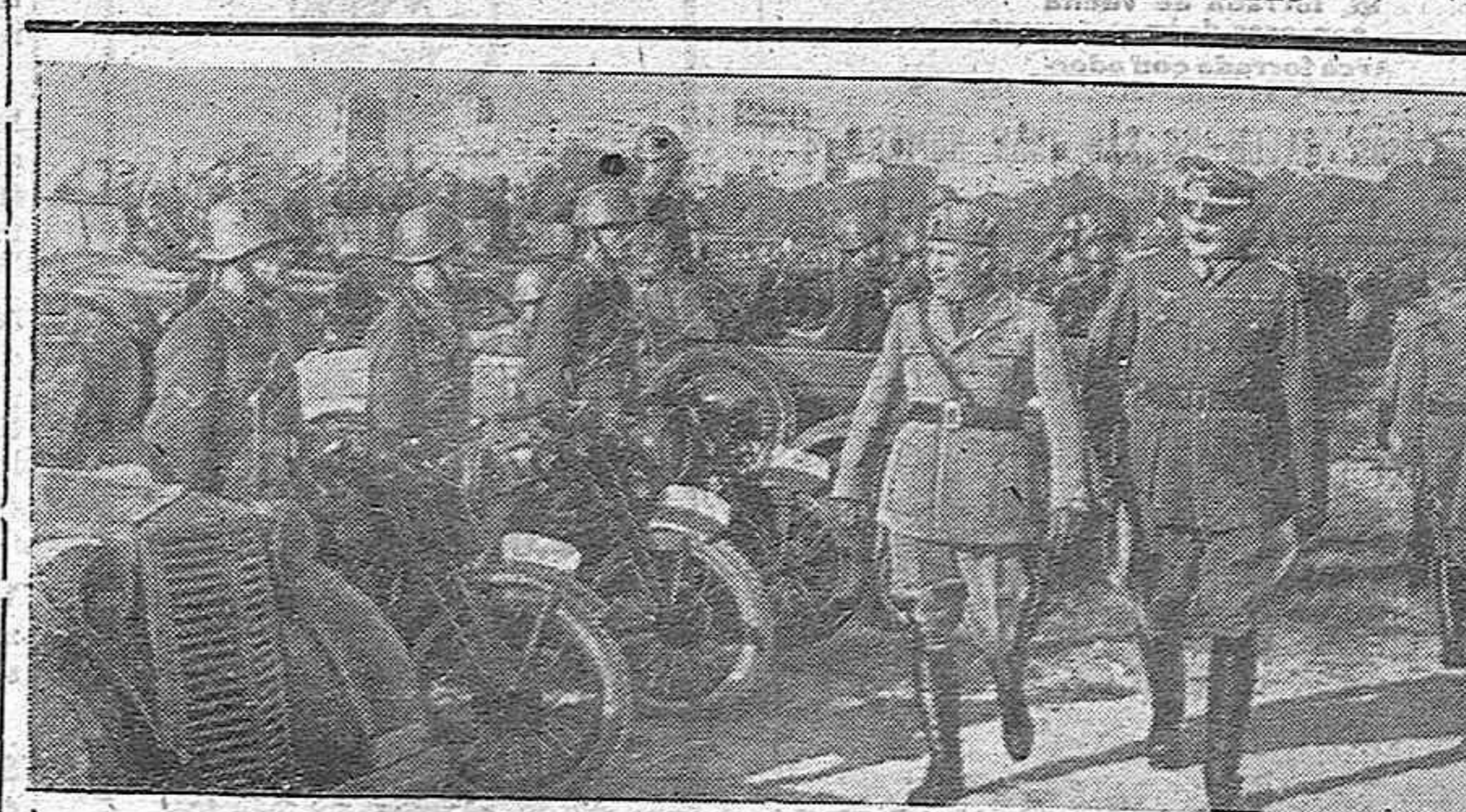
El Duce pasando revista a las tropas motorizadas italianas que han marchado recientemente a combatir contra el comunismo