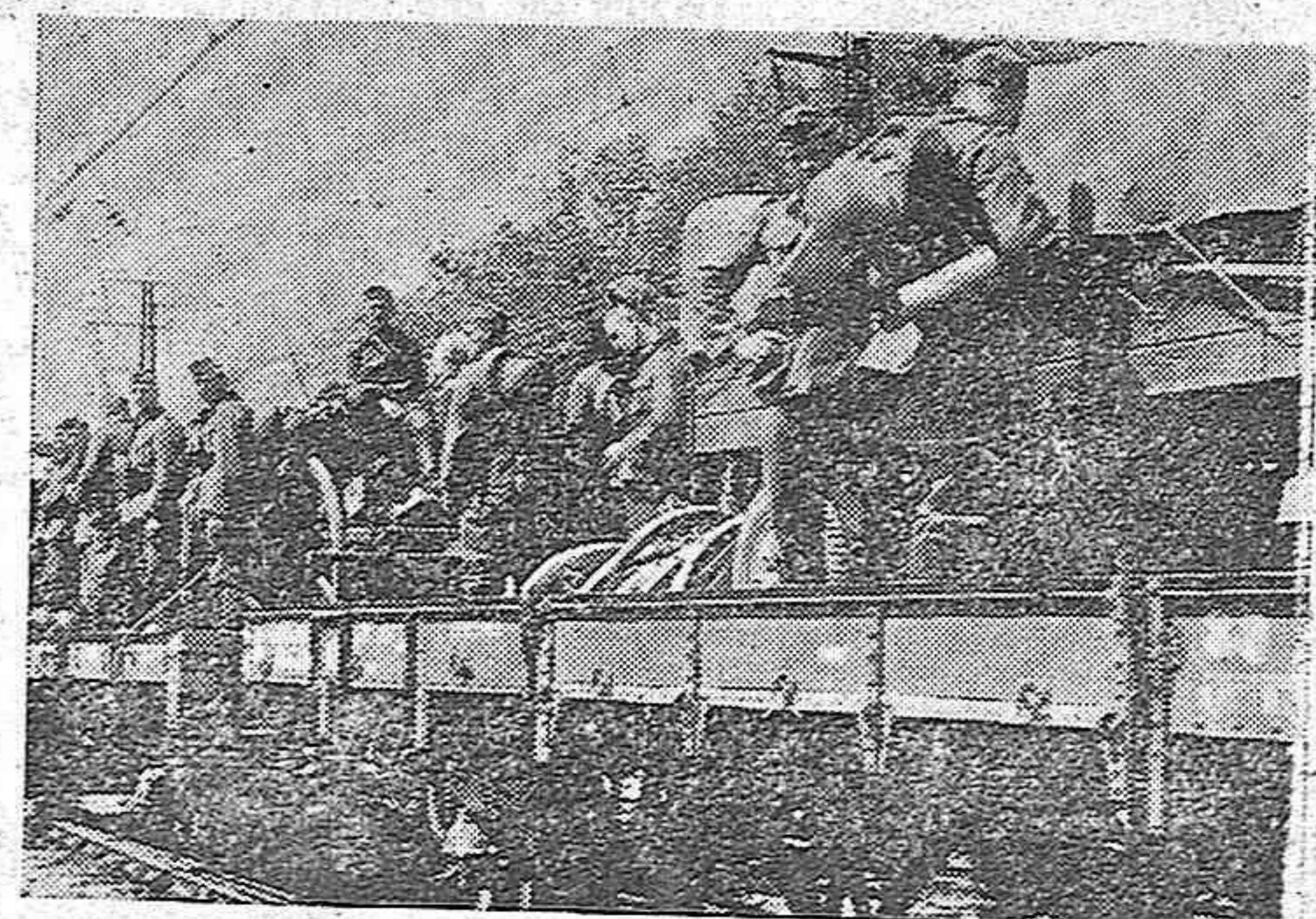
La lucha contra el comunismo.—Interminables filas de trenes transportan a los soldados alemanes a los nuevos frentes de lucha contra el comunismo

DEPOSITO PERMANENTE DE LUBRIFICANTES PARA AUTOMOVILES, USOS INDUSTRIALES Y AGRICOLAS