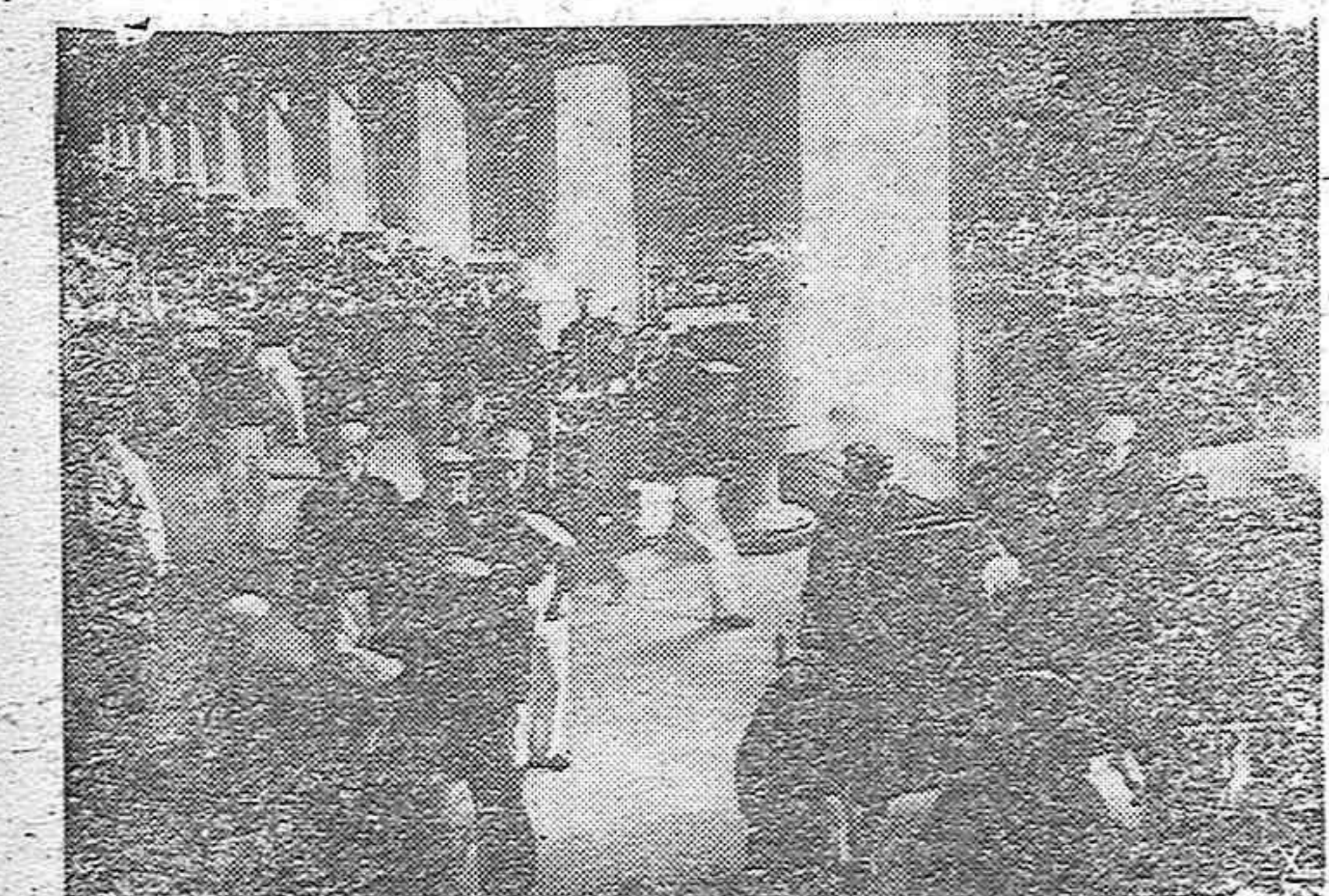
Alumnos de una escuela naval japonesa haciendo ejercicios con una pieza de artillería