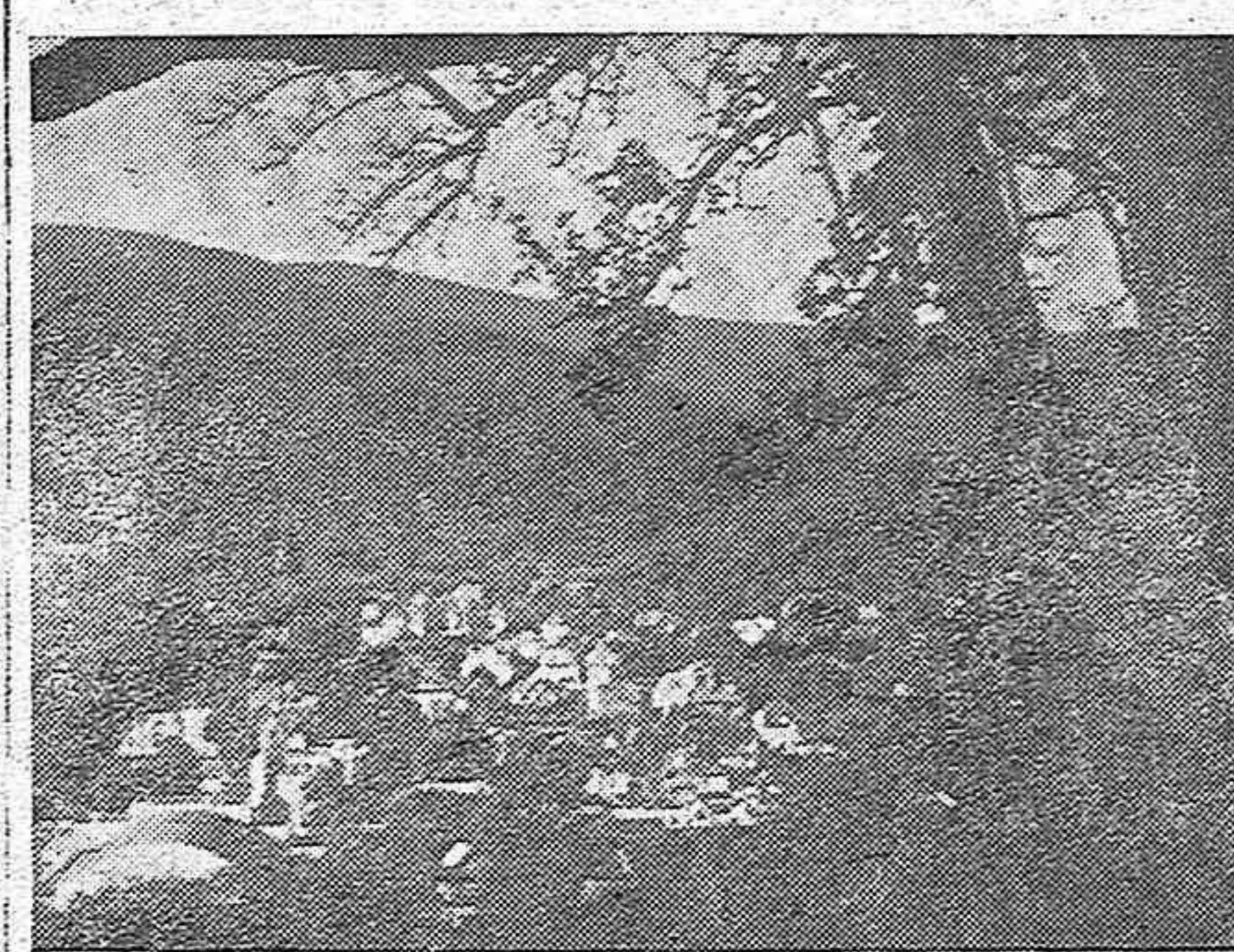
BLANKENBURG, primer jardín de la infancia, entre las montañas de Turingia

Algunos años mas tarde, incansante en su altruista labor, la daba fausto remate fundando el primer jardín de la infancia, en el Balneario de Blankenburg, entre las magníficas montañas de Turingia.