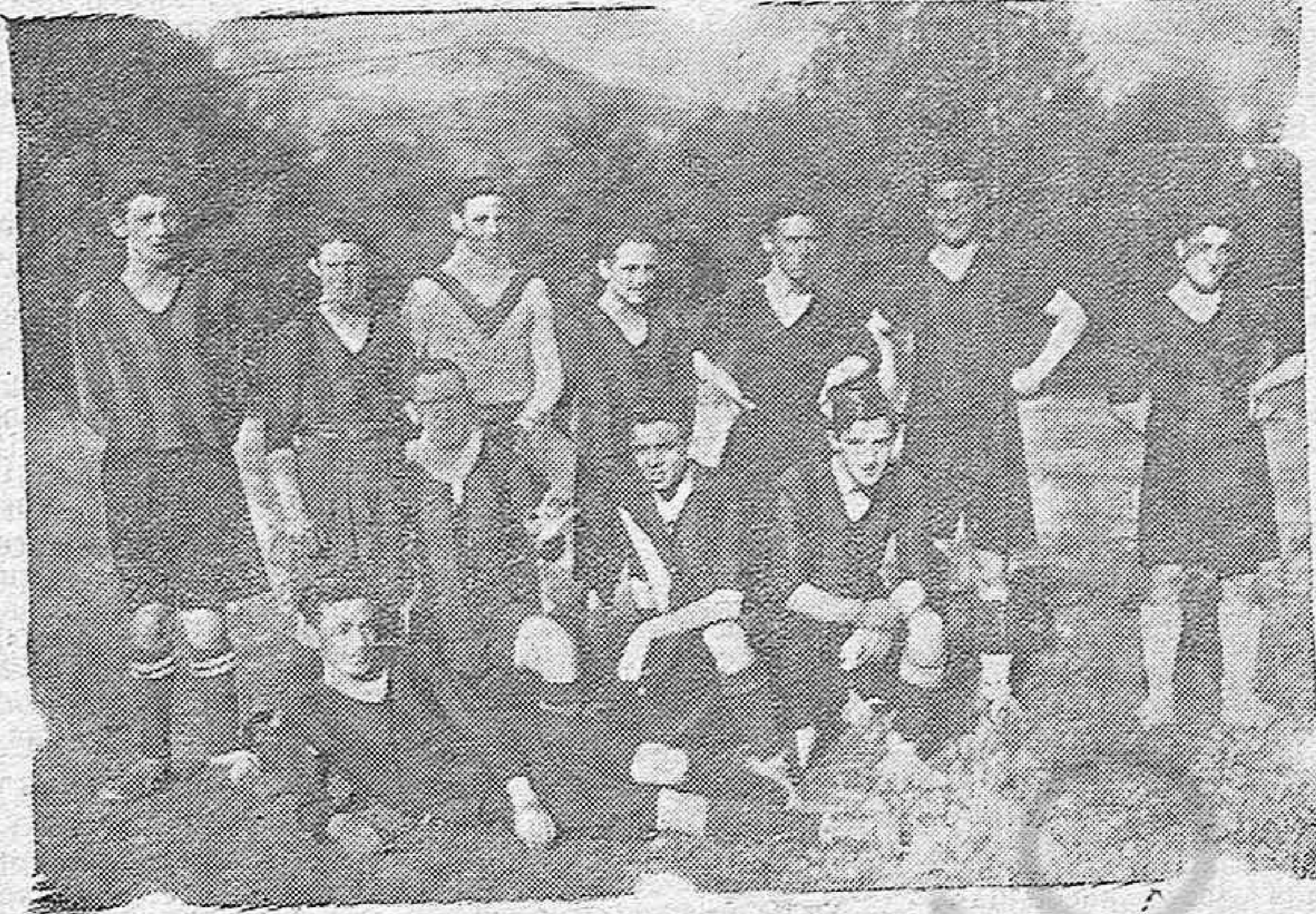
EQUIPO DEL SORIA F. C. QUE LUCHÓ EL DOMINGO ÚLTIMO CONTRA EL CINTORA F. C.