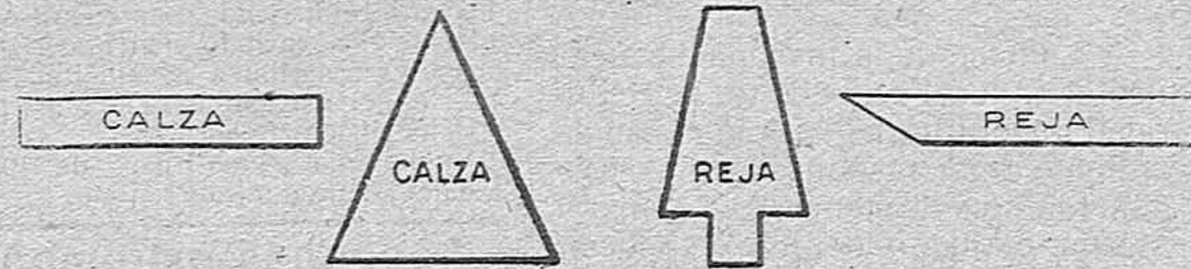
RECORTES Y PLETINAS PARA FABRICACIÓN DE HERRADURAS.