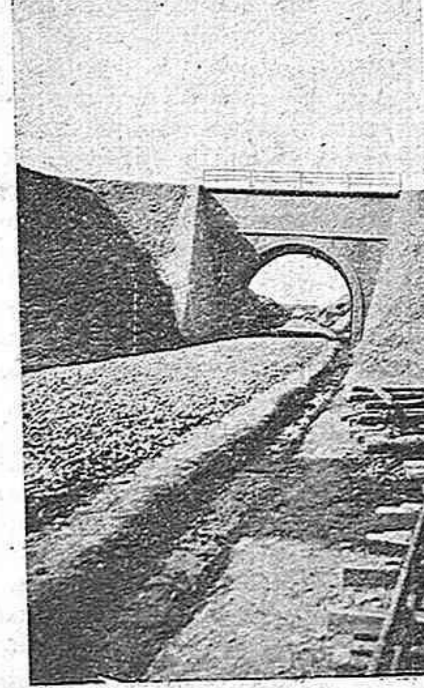
Hay camino abierto, esperando el tendido de los railes...