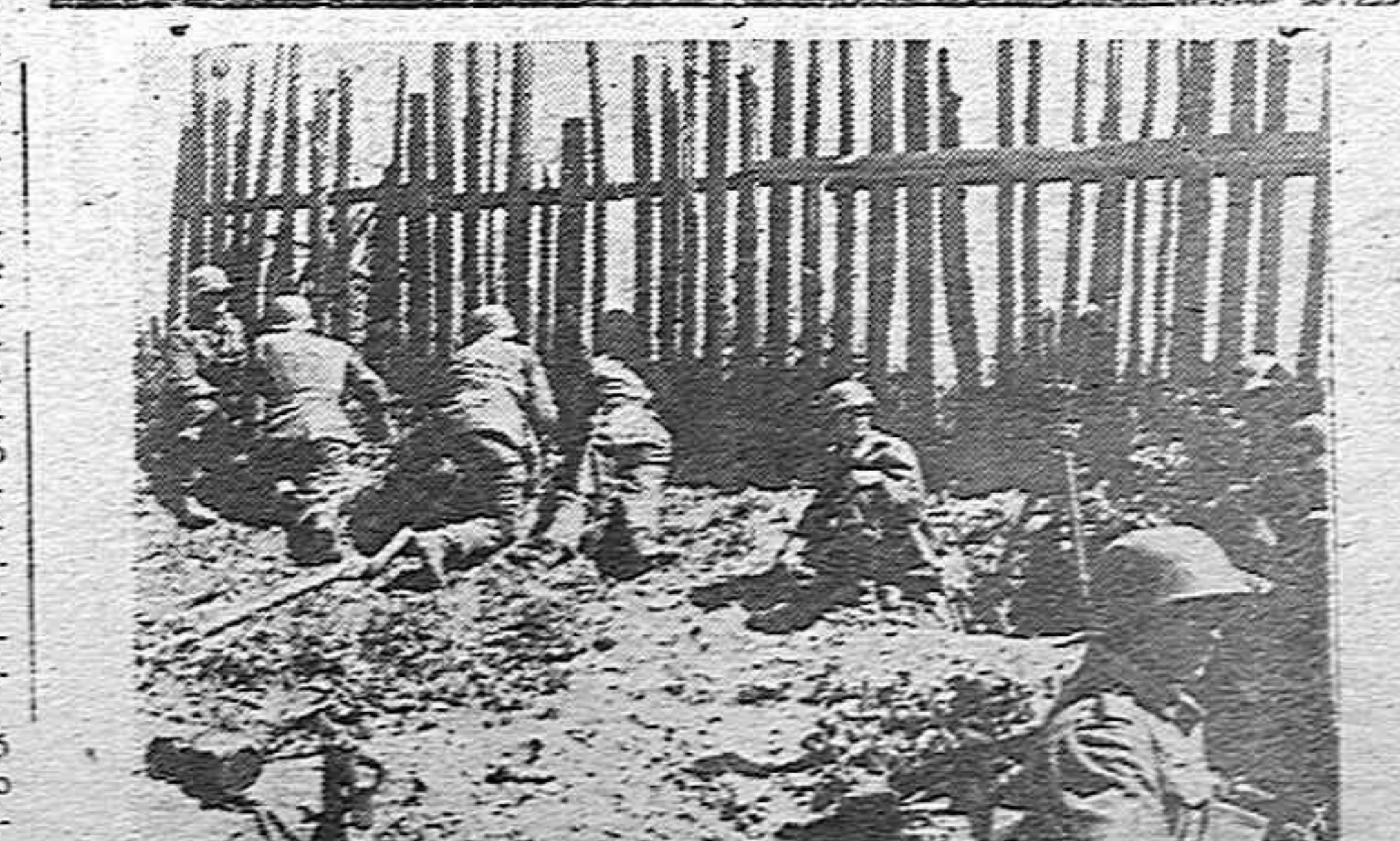
Avanzadilla alemana de tiradores a orilla del Dniéper

La nave es movida por cuatro motores Diesel, construidos por la Sociedad Española de Construcción Naval, de seis cilindros a cuatro tiempos, que desarrollan una potencia de 5.600 caballos.