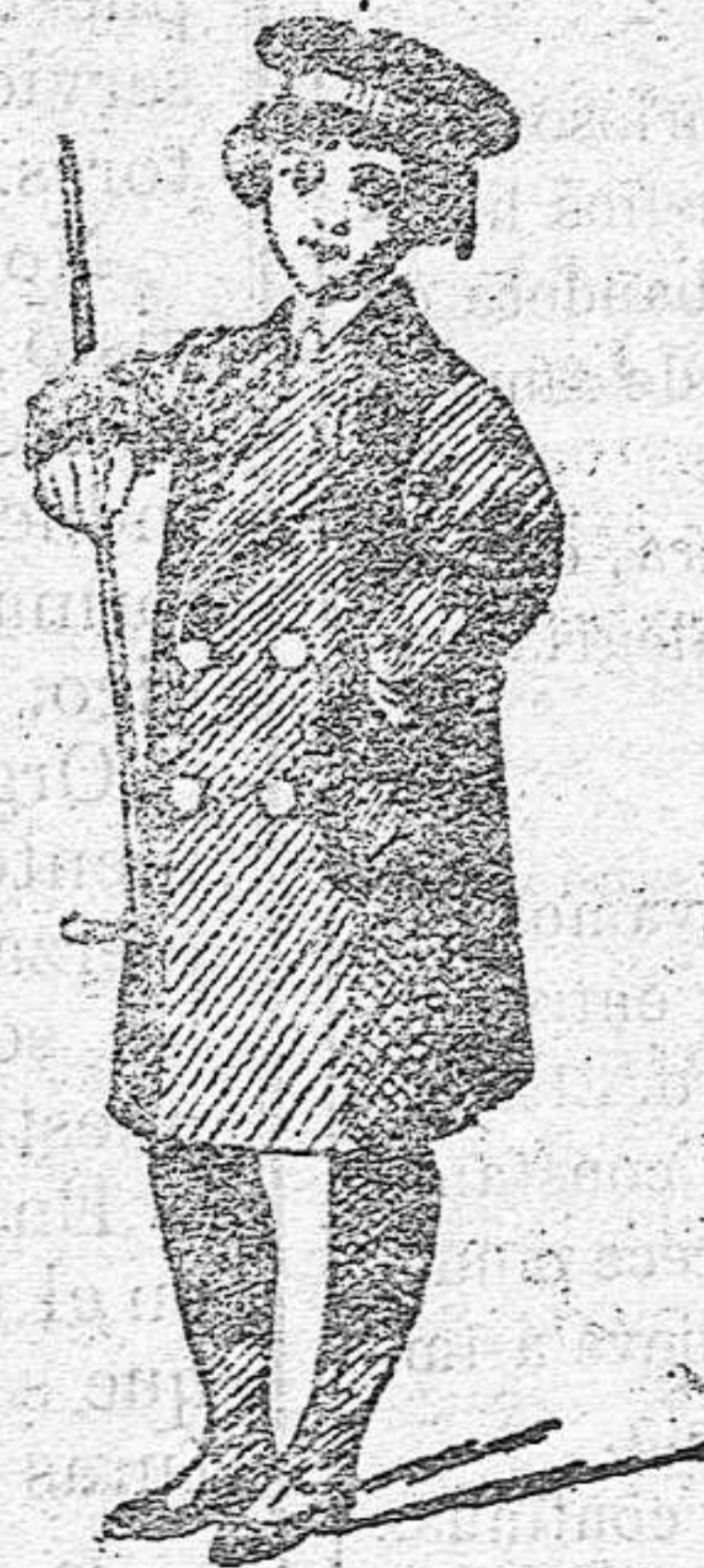
Gabancitos para niños de 10, 12, 18 y 30 pesetas