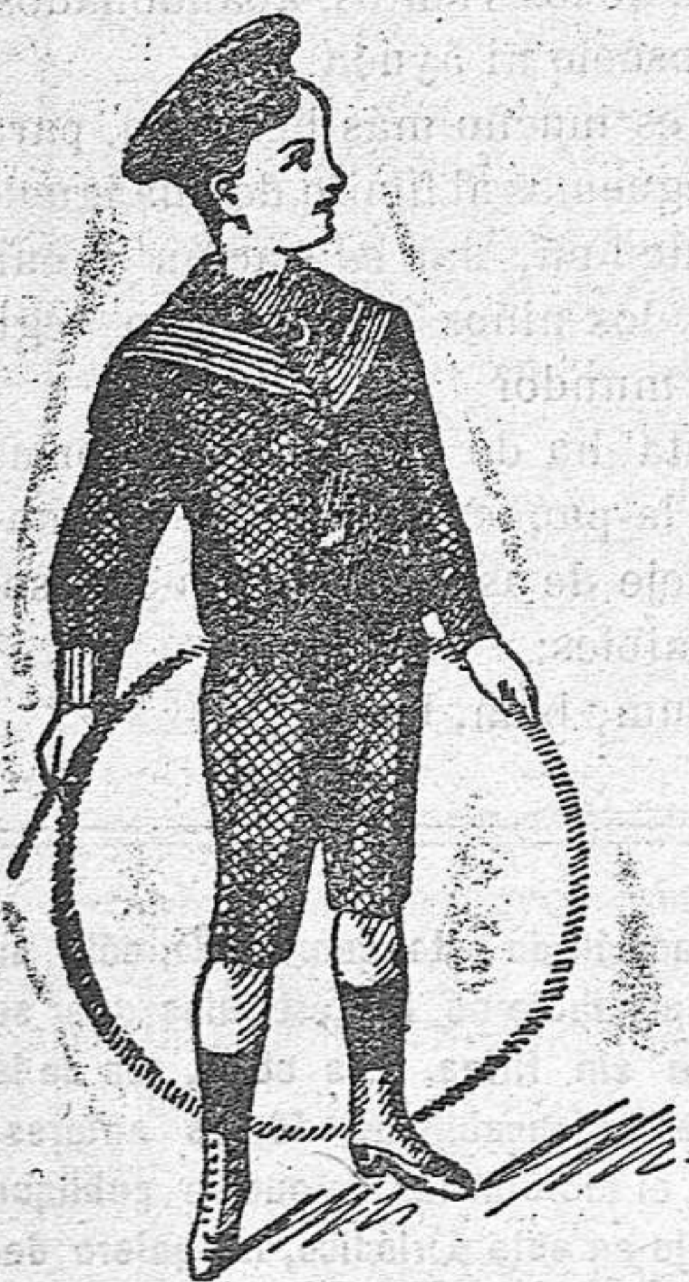
Modelos diferentes en trajecitos de paño

El mejor regalo para niños en Reyes, son las capitas impermeables.